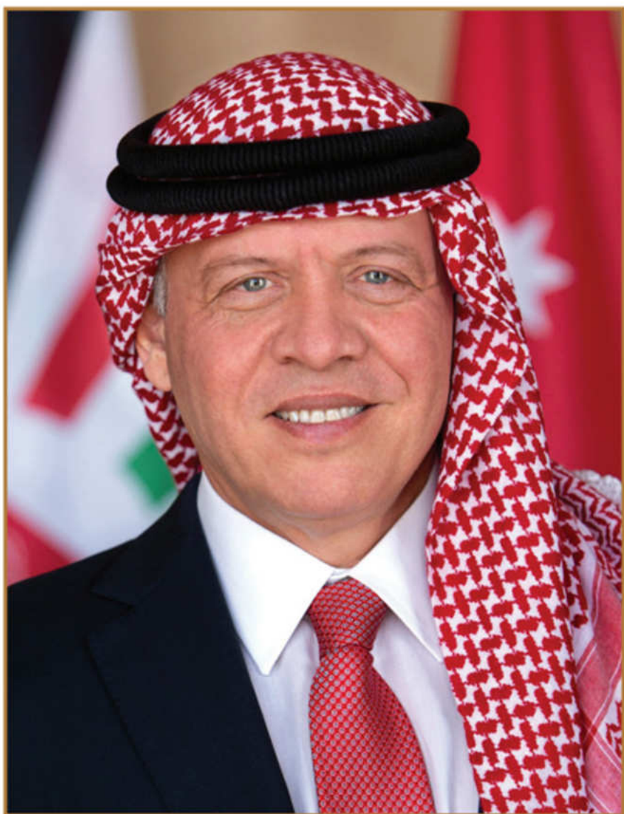
حضرة صاحب الجلالة ملك المملكة الأردنية الهاشمية عبد الله الثاني بن الحسين المعظم