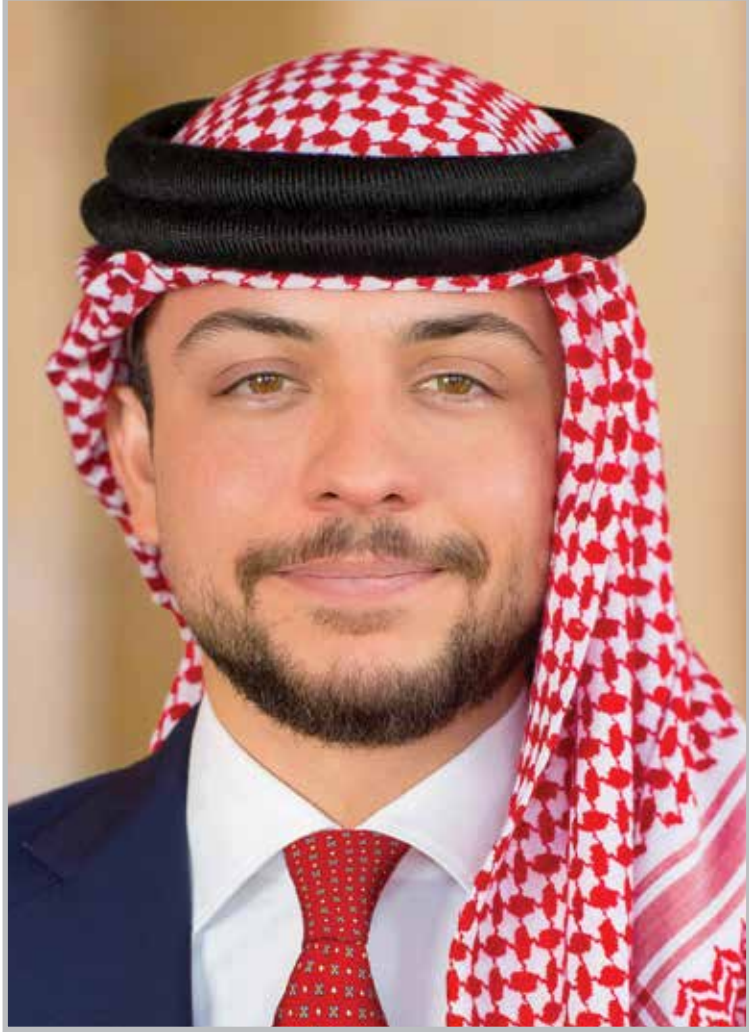
الأمير حفرة صاأب السمو الملكي الحسين بن عبد الله الثاني ولي العهد المعظم