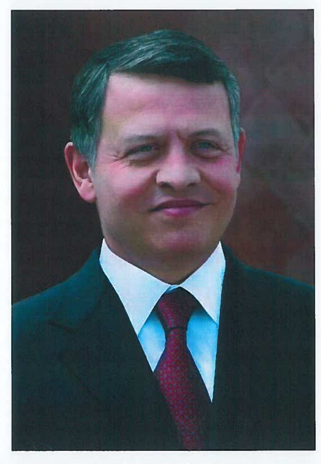
حضرة صاحب الجلالة الملك عبد الله الثاني بن الحسين