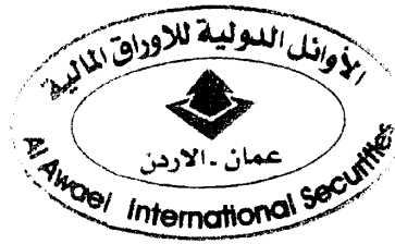
دانا العففي ضابط الامتثال