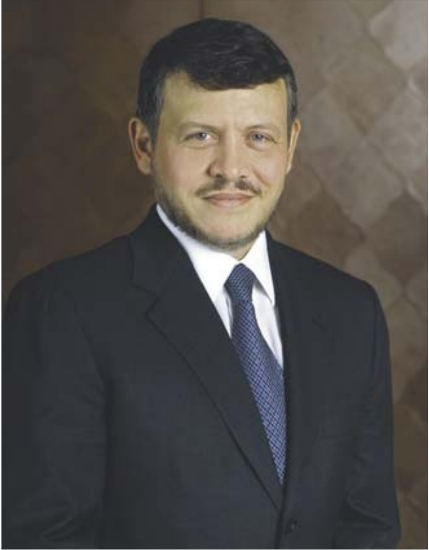
حضرة صاحب الجلالة الملك عبد الله الثاني بن الحسين حفظه الله