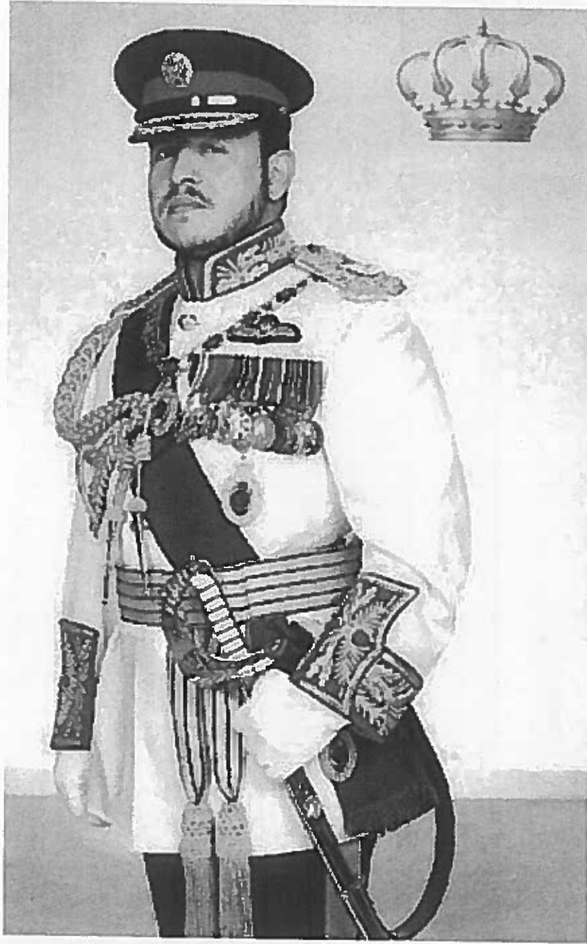
حضرة صاحب الجلالة الملك عبدالله الثاني بن الحسين المعظم