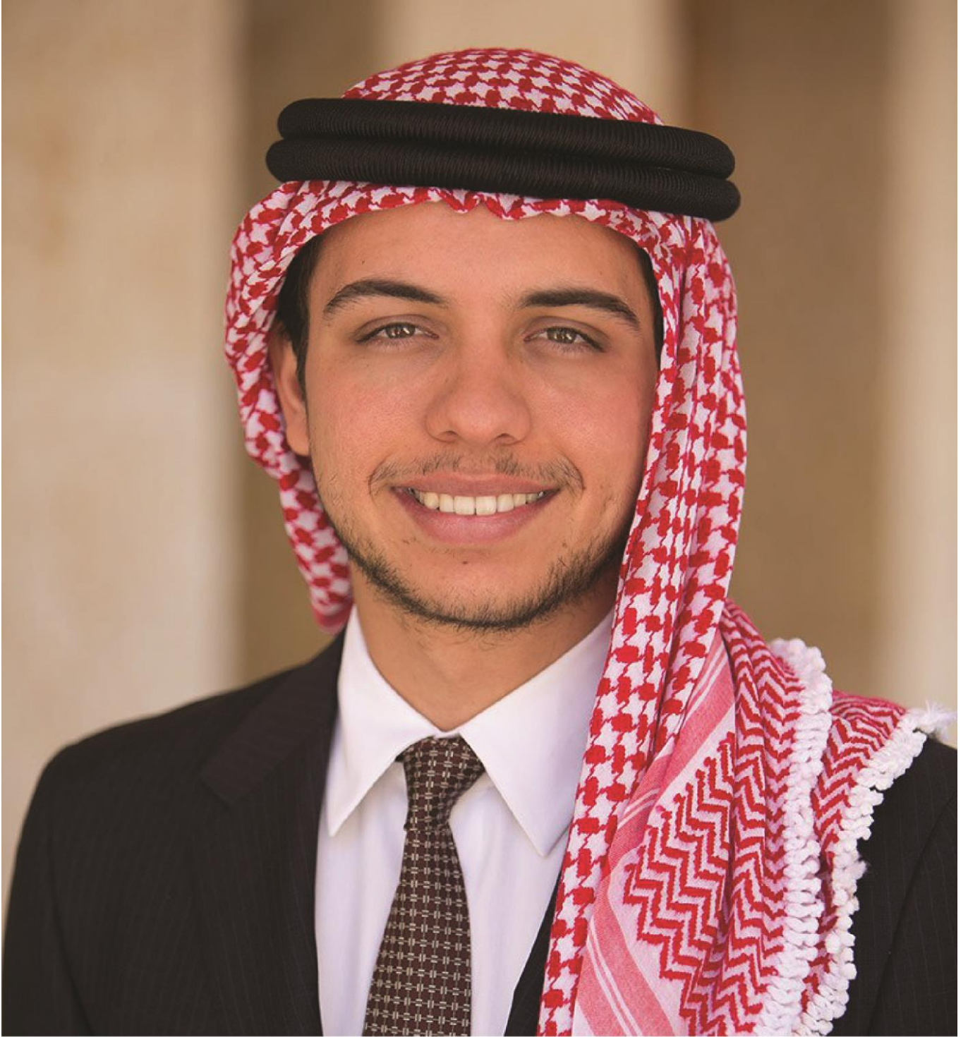
حضرة صاحب السمو الملكي ولي العهد الأمير الحسين بن عبد الله الثاني حفظه الله ورعاه