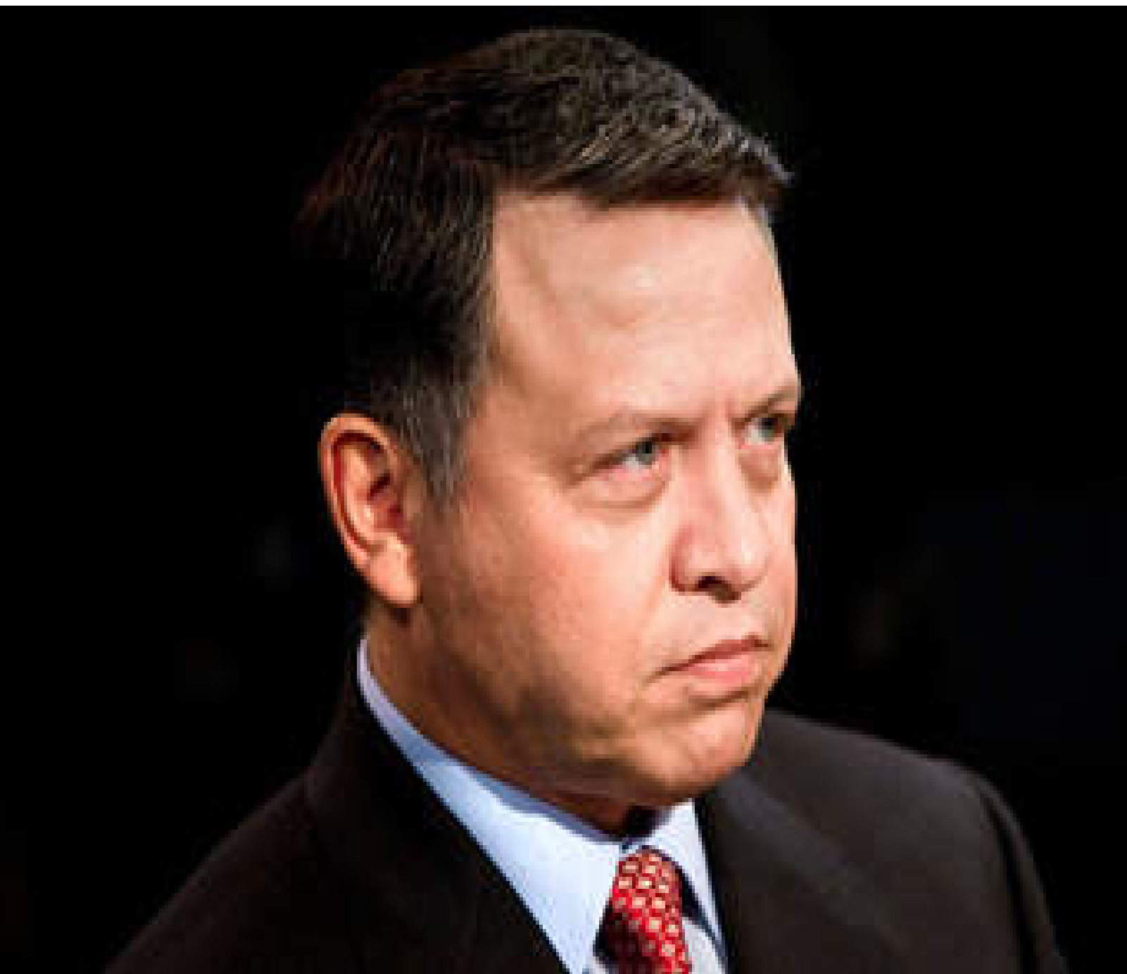
جلالة الملك عبدالله الثاني ابن الحسين المعظم