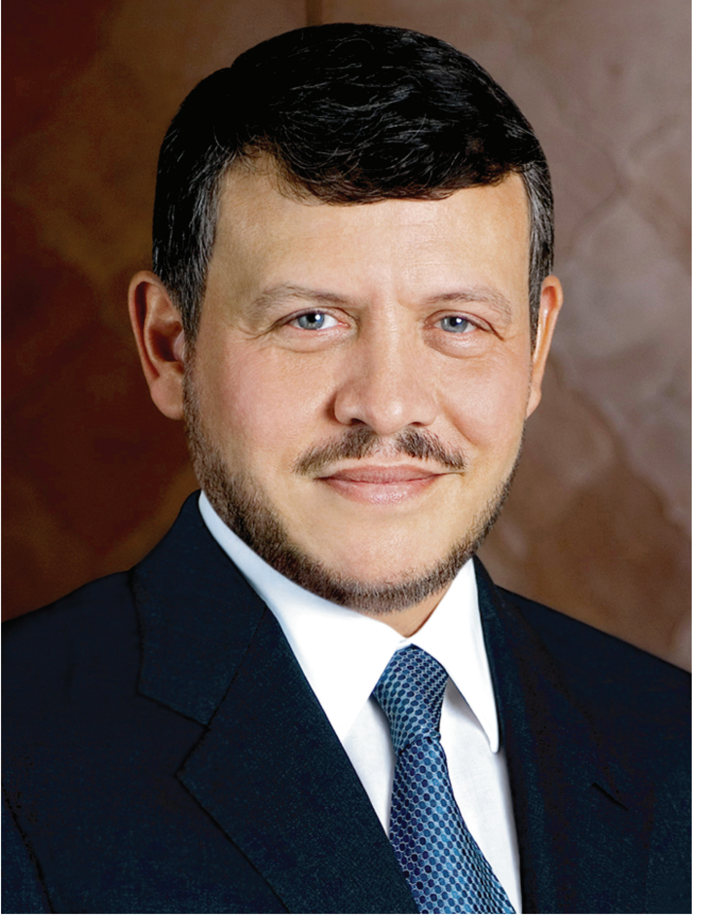
حضرة صاحب الجلالة الهاشمية الملك عبد الله الثاني بن الحسين المعظم