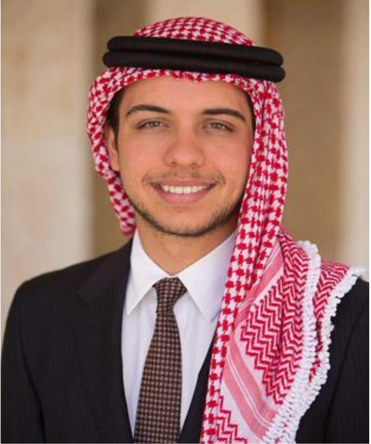
حضرة سمو الأمير الحسين بن عبد الله الثاني المعظم ولي العهد