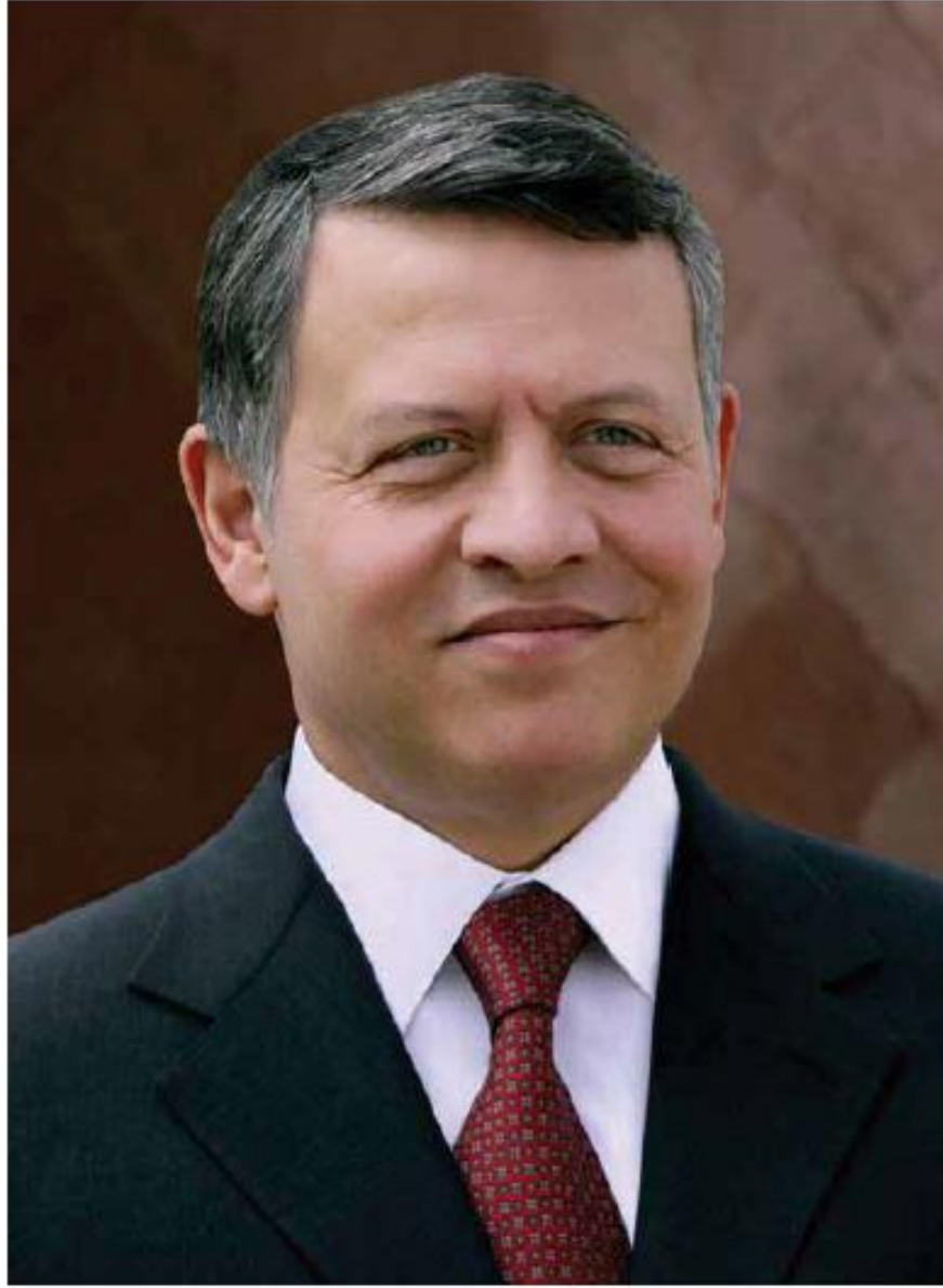
حضرة صاحب الجلالة الهاشمية الملك عبدالله الثاني بن الحسين المعظم