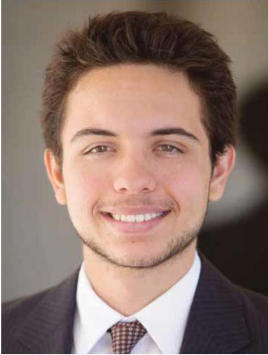
صاحب السمو الملكي الأمير الحسين بن عبدالله الثاني ولي العهد المعظم