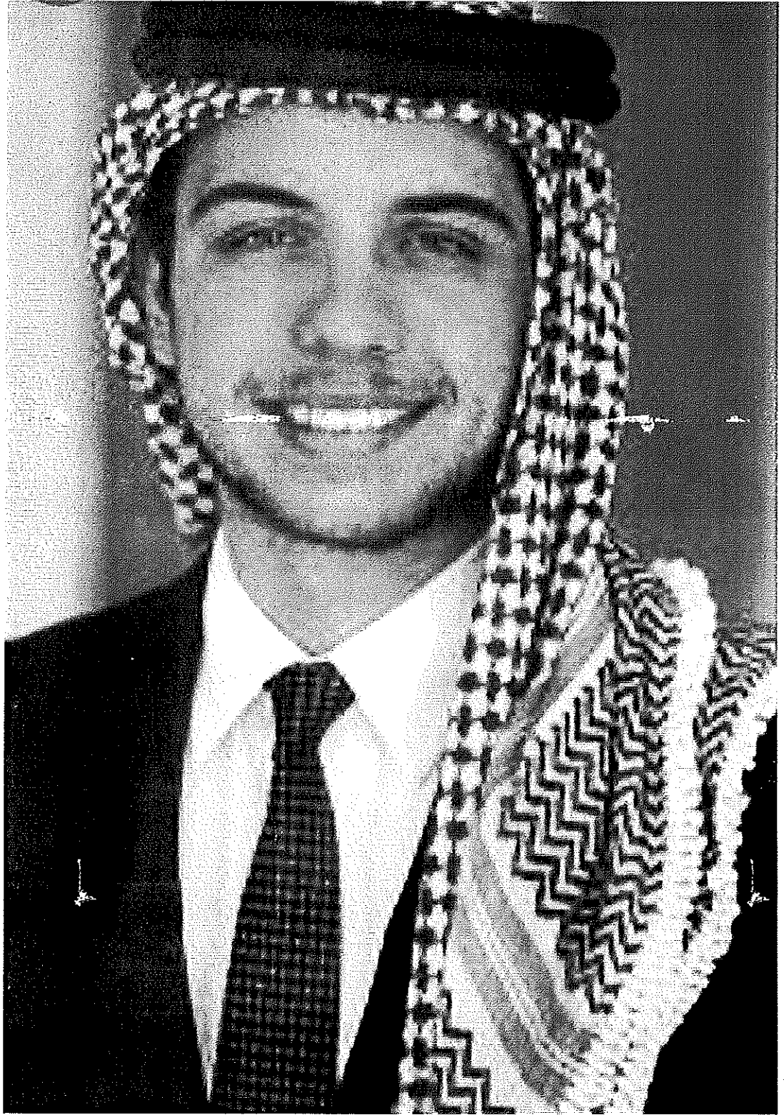
حضرة صاحب السمو الملكي ولي العهد الأمير الحسين بن عبدالله الثاني المعظم