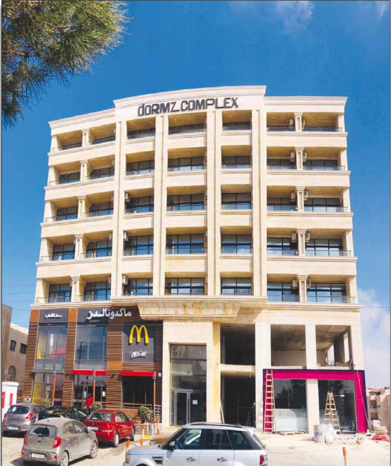
مجمع شركة هامن العقارية