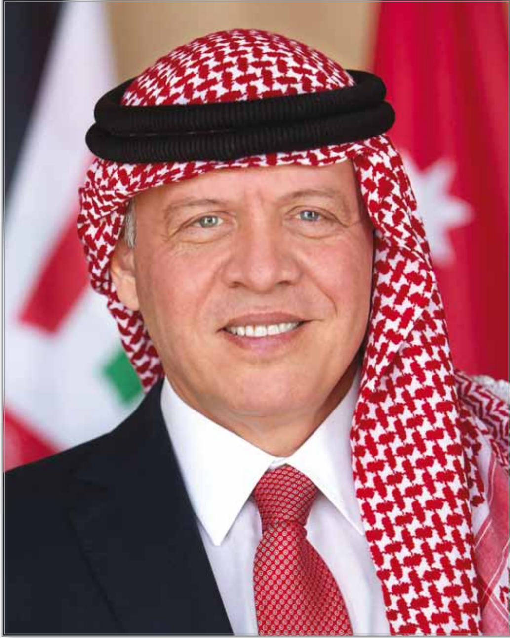
حضرة صاحب الجلالة الهاشمية الملك عبدالله الثاني ابن الحسين المعظم