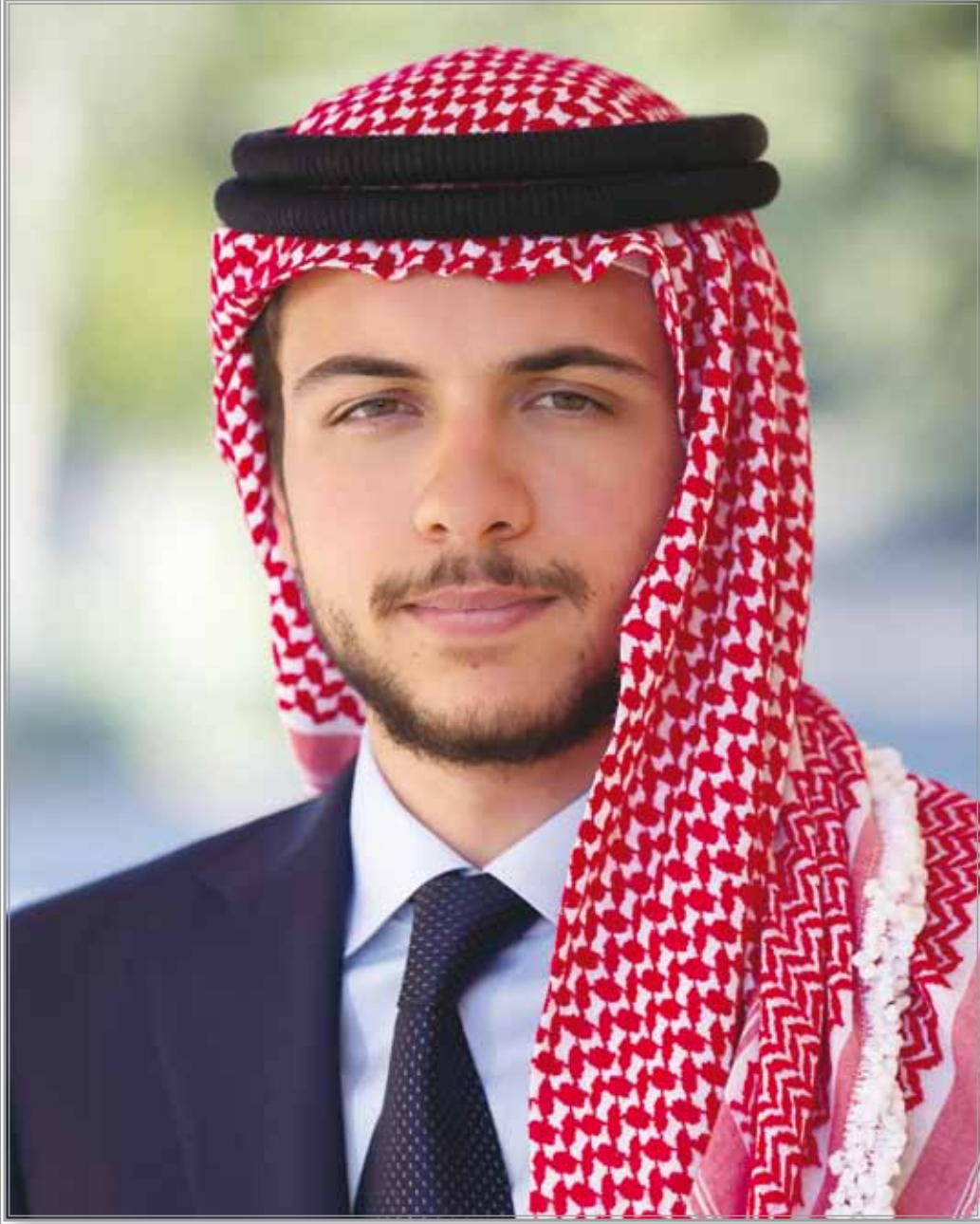
صاحب السمو الملكي الأمير الحسين ابن عبدالله الثاني ولي العهد