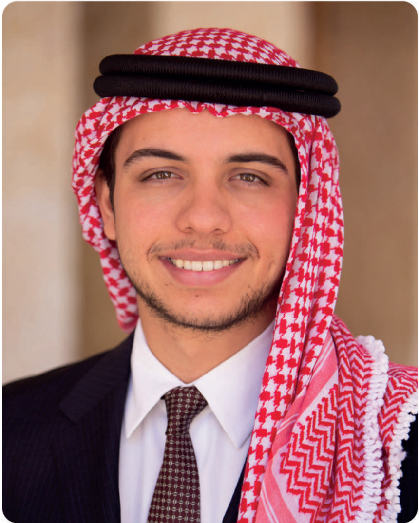
محاضرة صاحب السمو الملكي الأمير حميد بن عبد الله الثاني المعظم