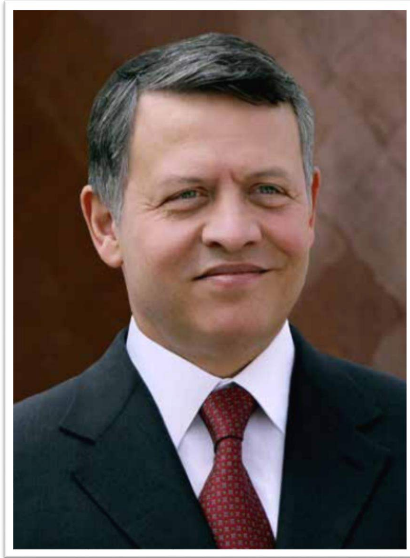
حضرة صاحب الجلالة الملك عبدالله الثاني بن الحسين المعظم