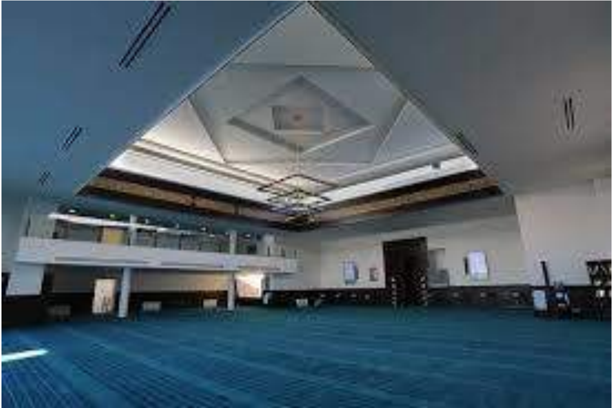
مجلس ادارة الشركة