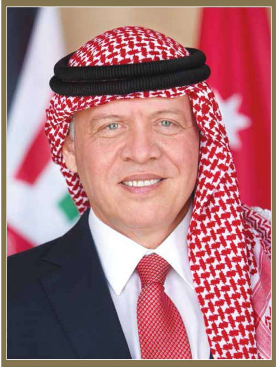
حضرة صاحب الجلالة الملك عبد الله الثاني ابن الحسين المعظم