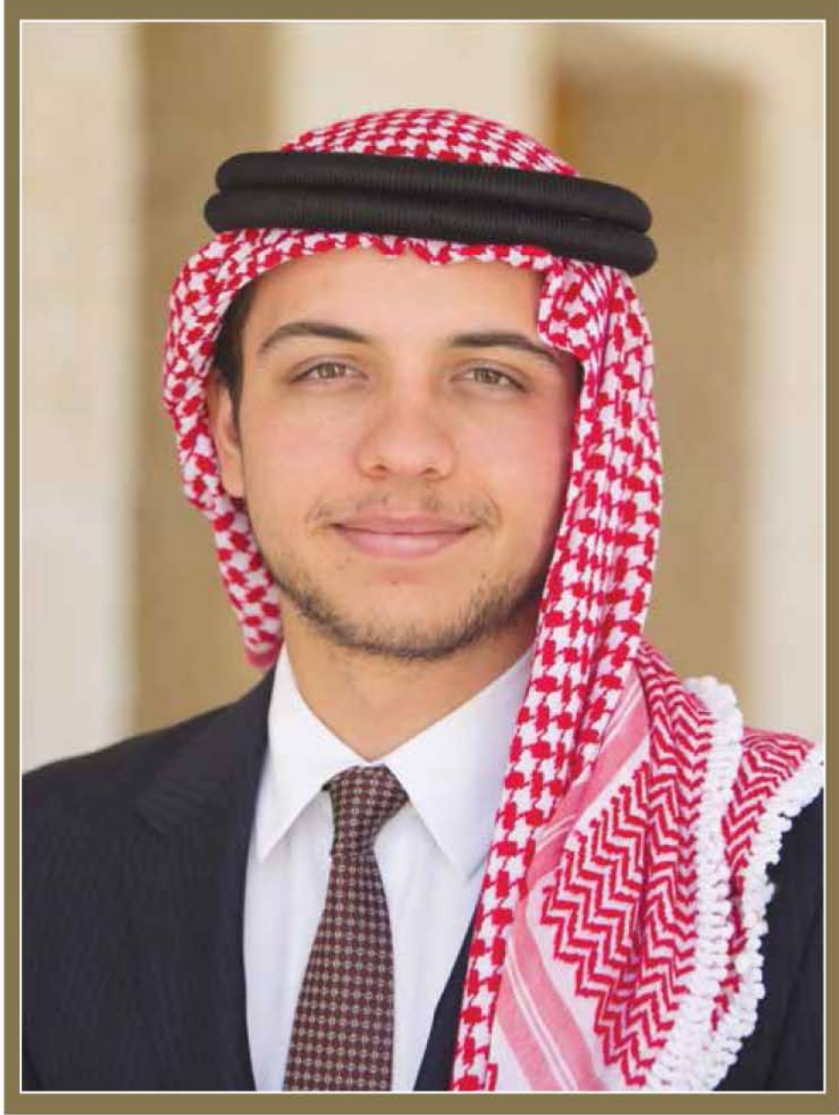
ولاي العهد سمو الأمير الحسين بن عبد الله الثاني