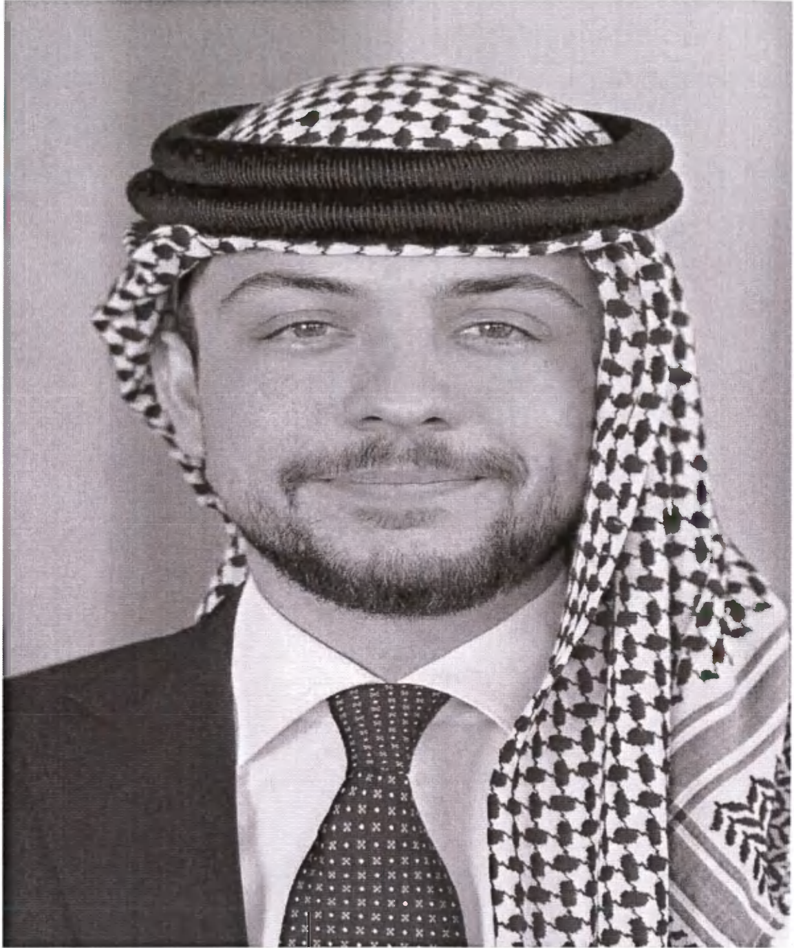
حضرة صاحب السمو الملكي الامير الحسين بن عبدالله الثاني المعظم ولي العهد