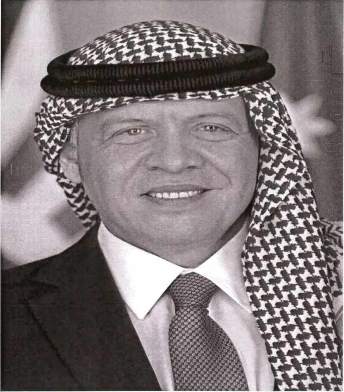
حضرة صاحب الجلالة الهاشمية الملك عبدالله الثاني بن الحسين المعظم