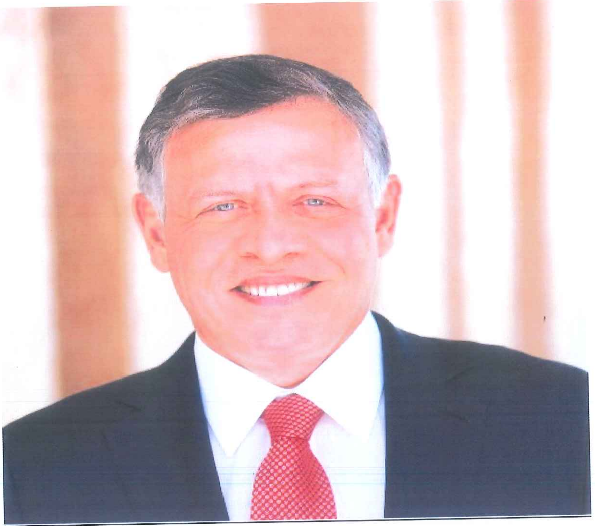
حضرة صاحب الجلالة الملك عبدالله الثاني بن الحسين حفظه الله و رعاه