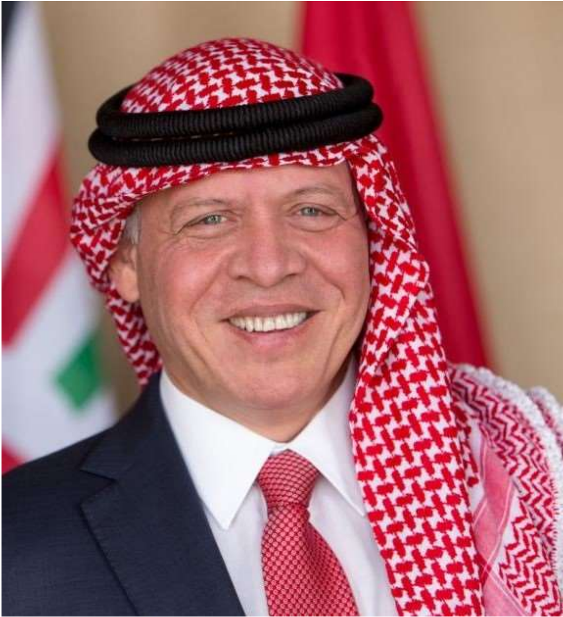
حضرة صاحب الجلالة الملك عبدالله الثاني بن الحسين المعظم