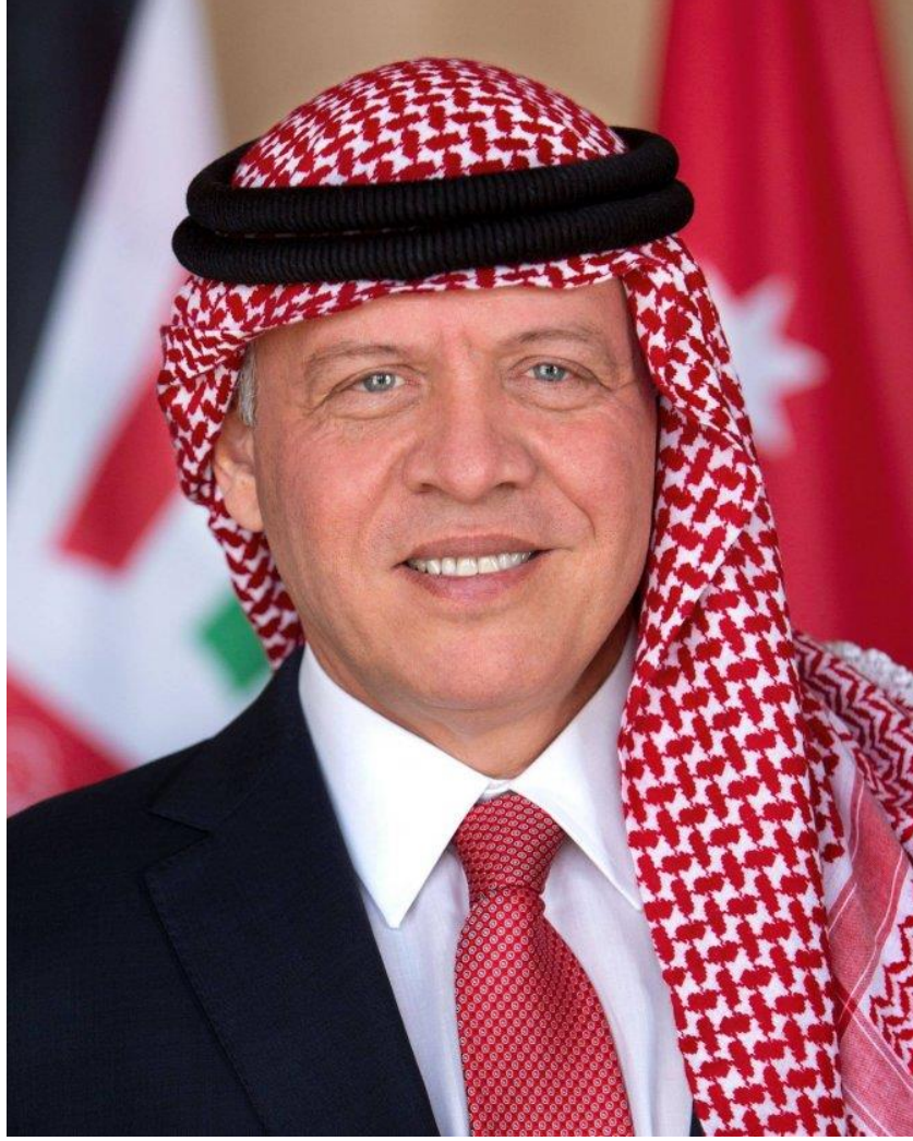
حضرة صاحب الجلالة الهاشمية الملك عبد الله الثاني ابن الحسين المعظم حفظه الله