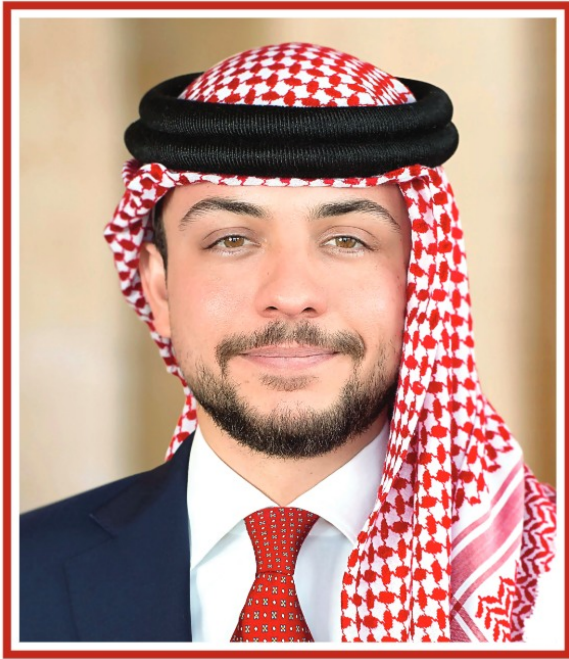
صاحب السمو الملكي الأمير الحسين بن عبدالله الثاني ولي العهد المعظم حفظه الله