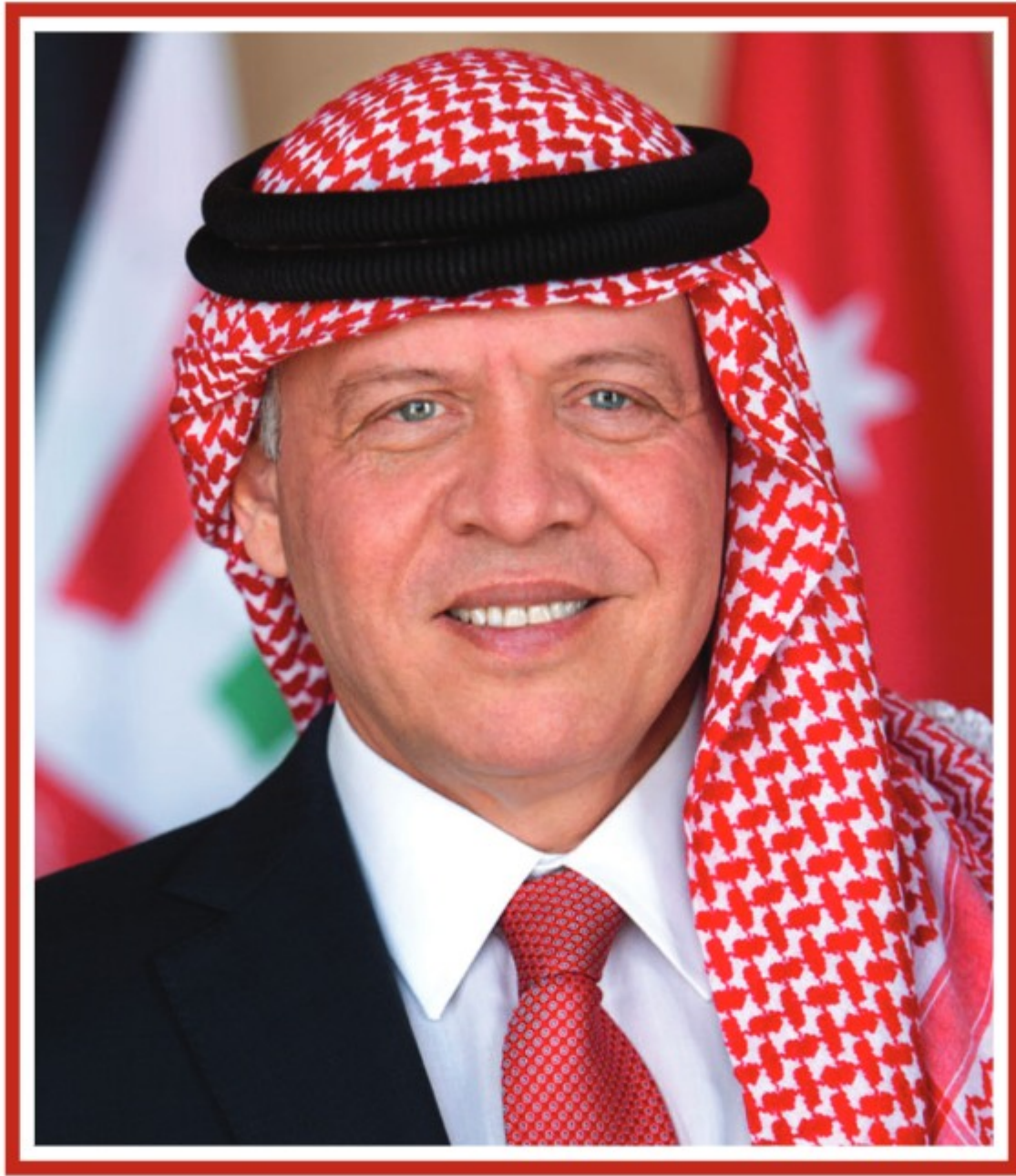
حضرة صاحب الجلالة الهاشمية الملك عبدالله الثاني ابن الحسين المعظم حفظه الله