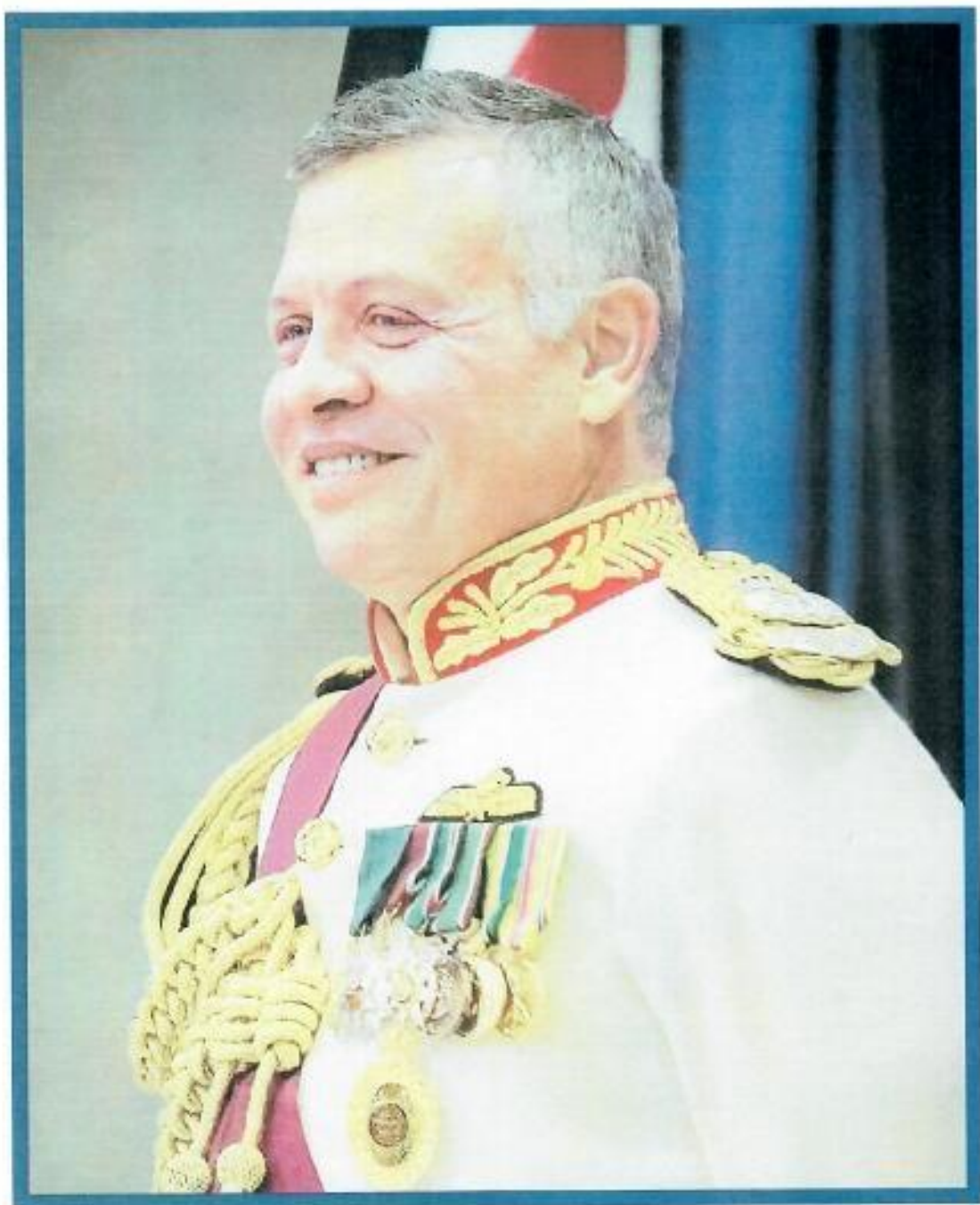
حضرة صاحب الجلالة الهاشمية الملك عبد الله الثاني ابن الحسين المعظم حفظه الله