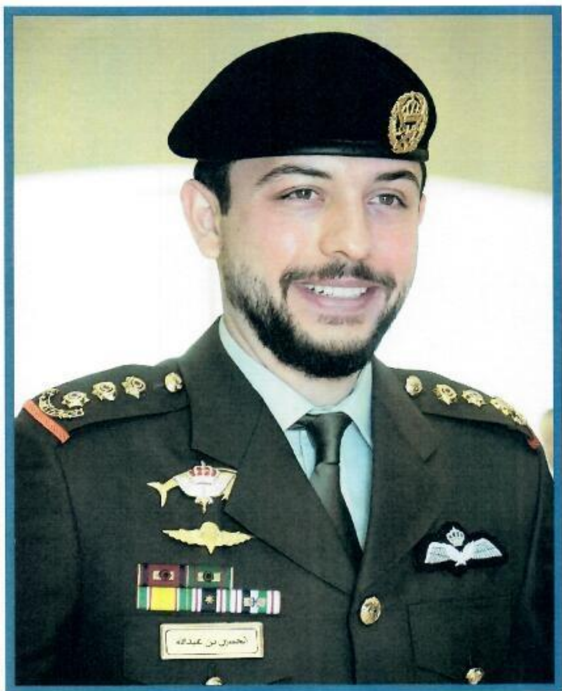
صاحب السمو الملكي الأمير الحسين بن عبد الله الثاني ولي العهد المعظم