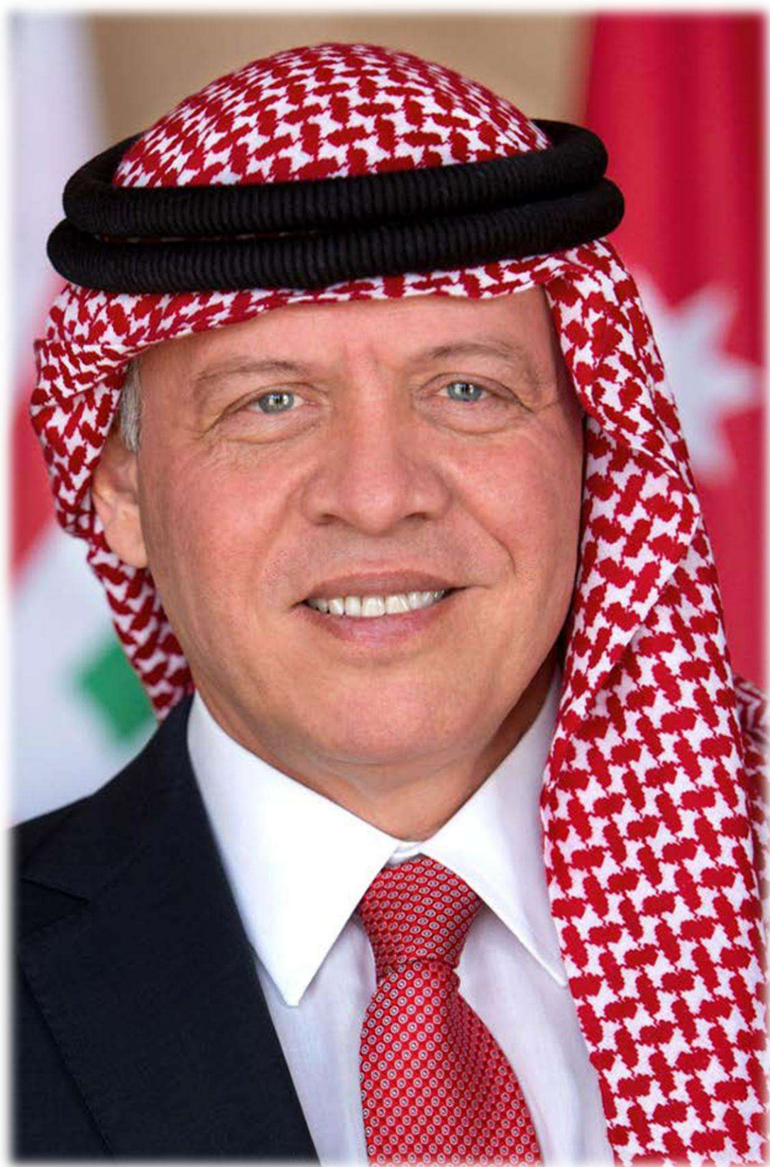
حضرة صاحب الجلالة الهاشمية الملك عبدالله الثاني بن الحسين المعظم