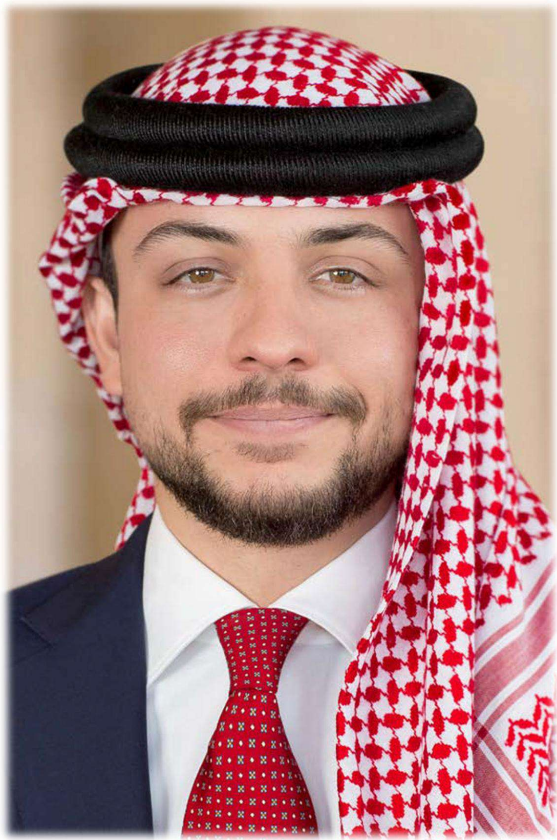
صاحب السمو الملكي الأمير الحسين بن عبدالله الثاني ولي العهد المعظم