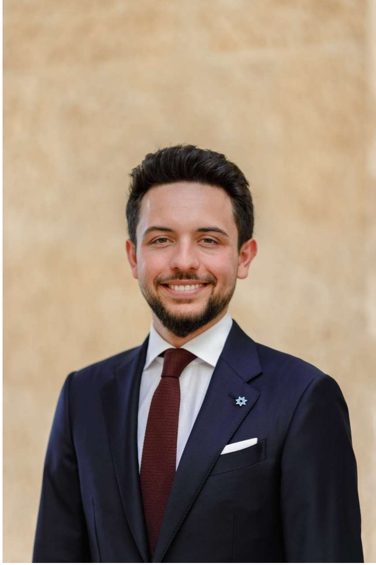
حضرة صاحب سمو الأمير الحسين بن عبدالله الثاني ولي العهد المعظم