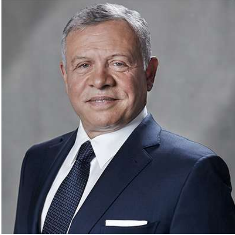
حضرة صاحب الجلالة ملك المملكة الأردنية الهاشمية عبدالله الثاني بن الحسين المعظم