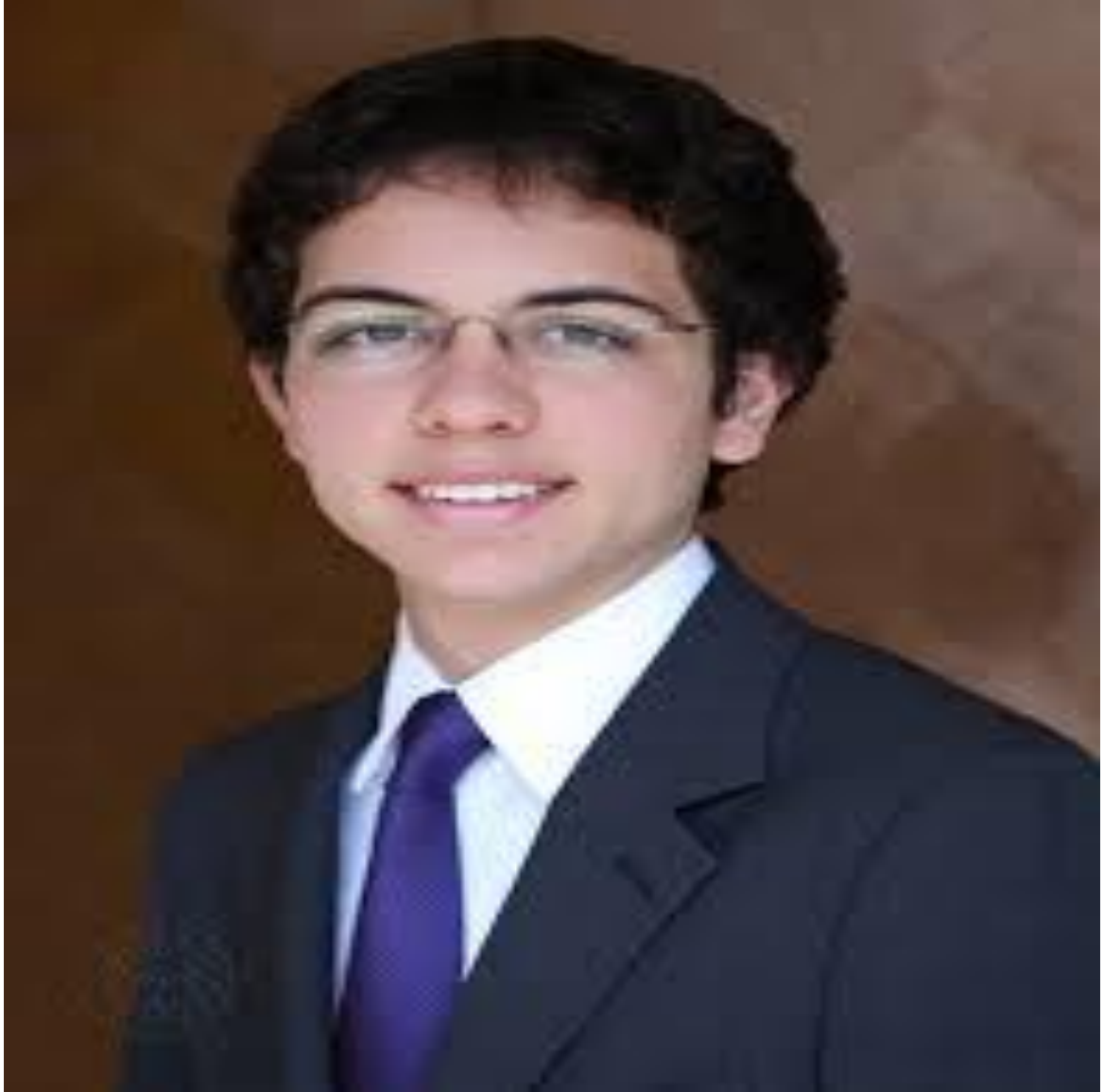
صاحب السمو الملكي الأمير الحسين بن عبد الله الثاني ولي العهد المعظم