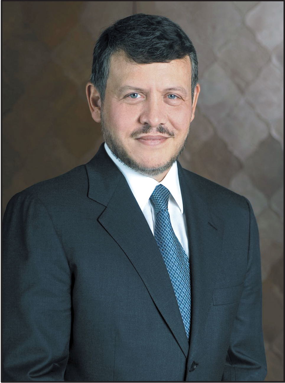
صاحب الجلالة الملك عبد الله الثاني بن الحسين المعظم