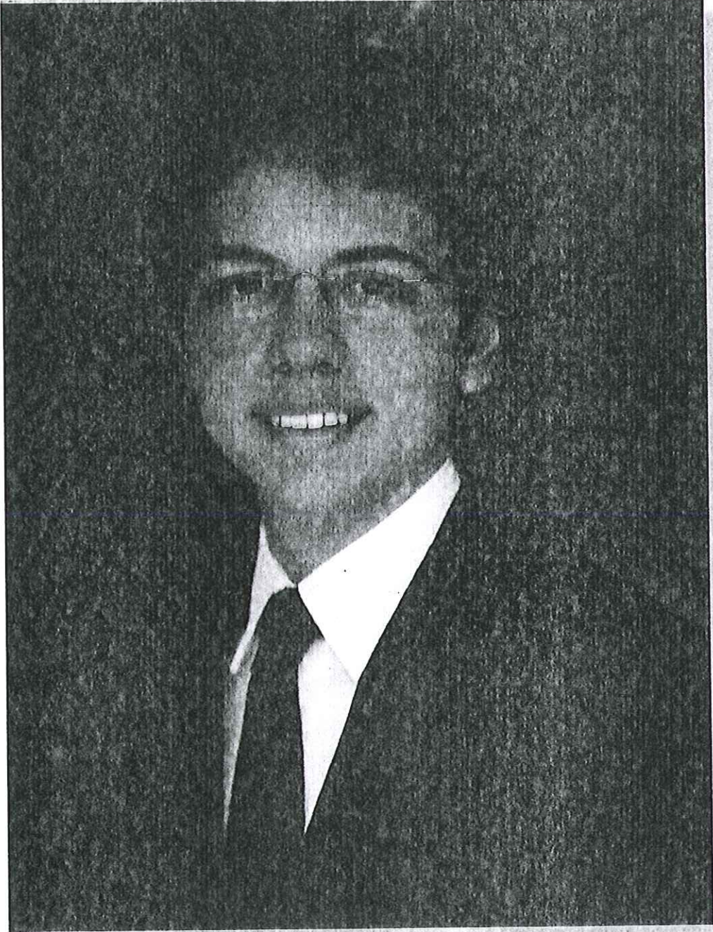
حضرة صاحب السمو الملكي الأمير الحسين بن عبد الله الثاني ولي العهد المعظم