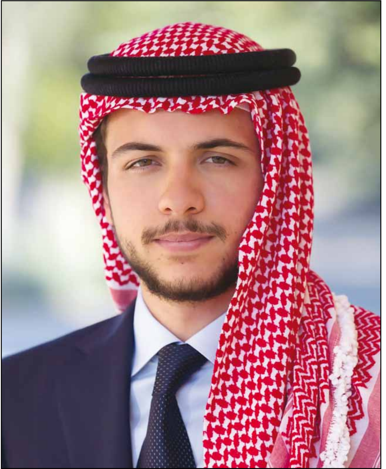
حضرة صاحب السمو الملكي الأمير حسين ابن عبدالله الثاني ولي العهد