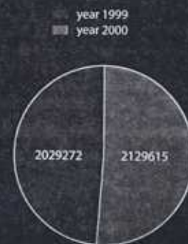
التفرد لدى البنوك للأعوام 2000-1999