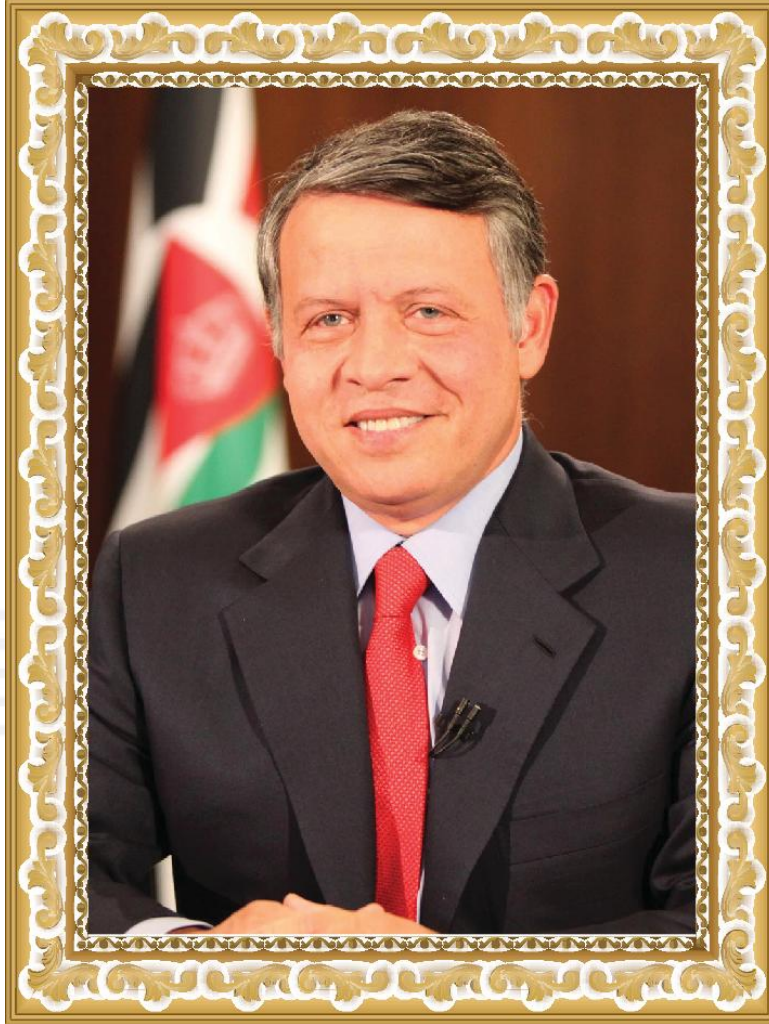
حضرة صاحب الجلالة الملك عبدالله بن الحسين المعظم