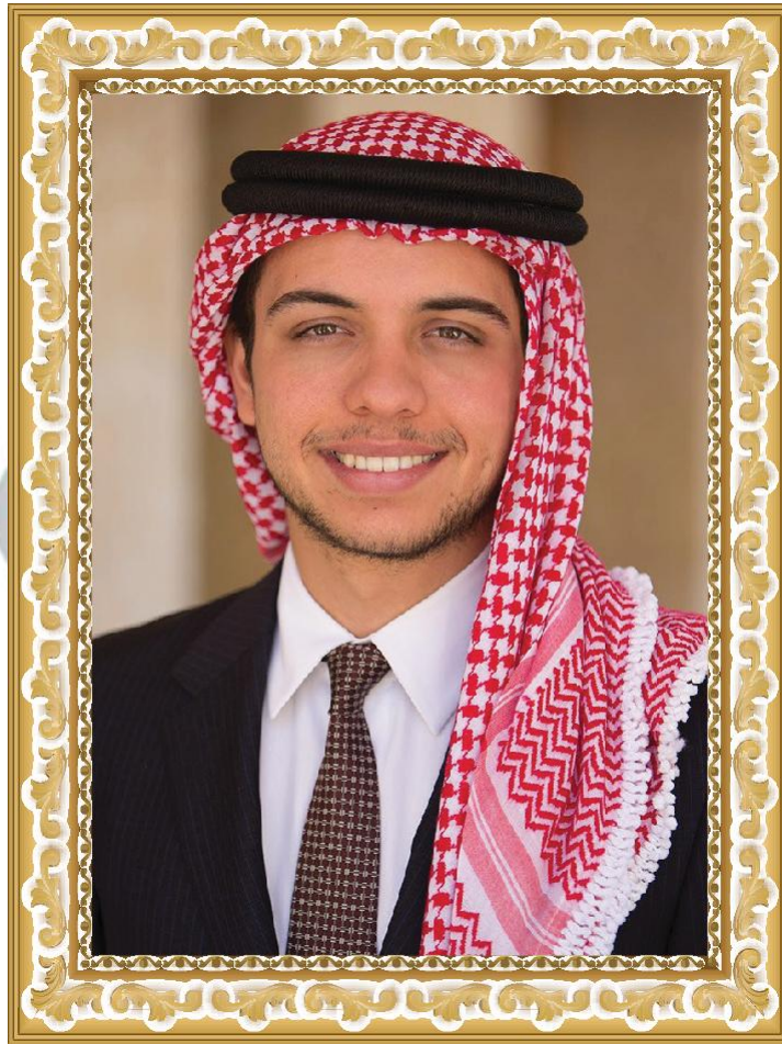
صاحب السمو الملكي الأمير الحسين بن عبد الله ولي العهد