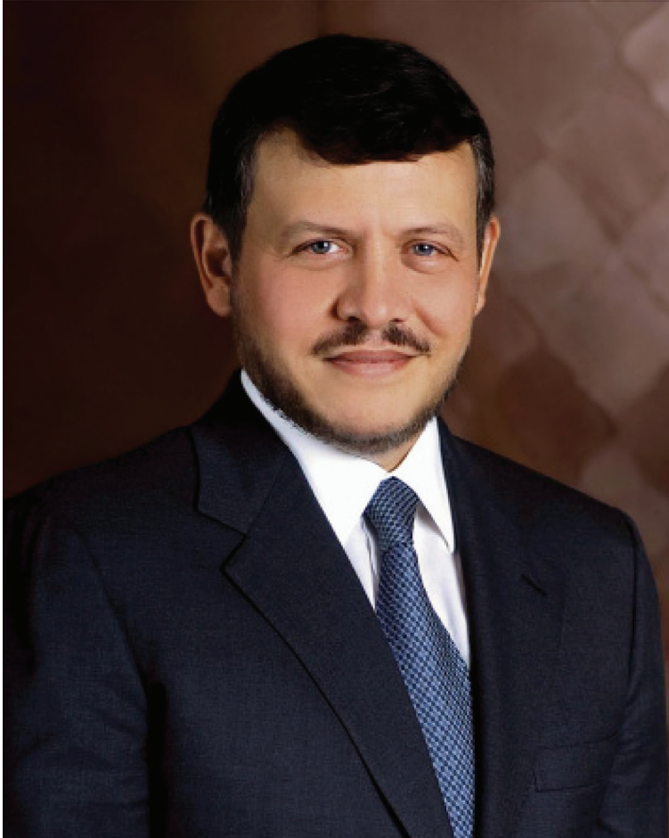
حضرة صاحب الجلالة الملك عبد الله الثاني بن الحسين حفظه الله ورعاه