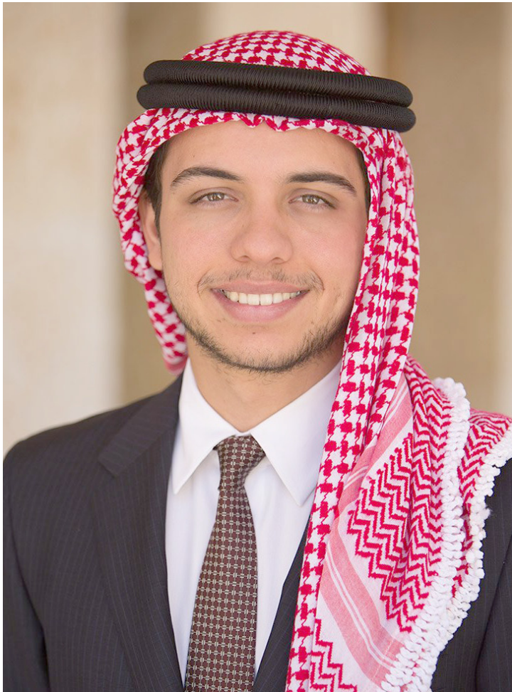
حضرة سمو ولي العهد الحسين بن عبد الله الثاني حفظه الله ورعاه