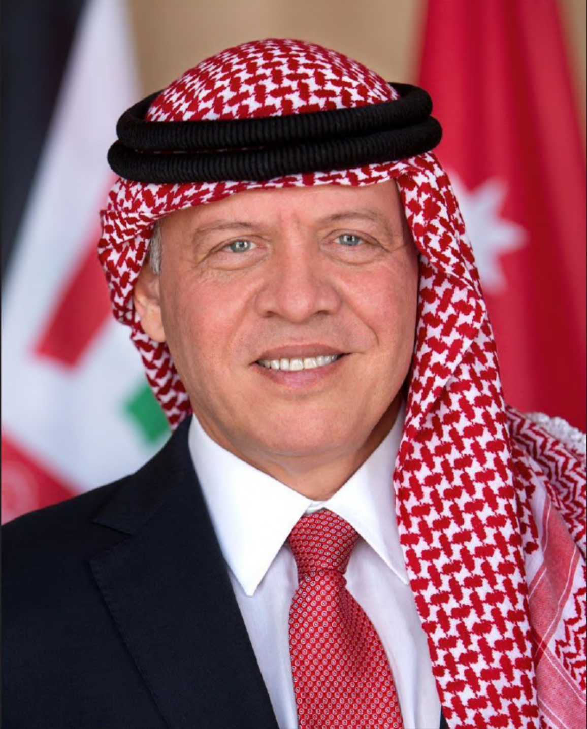
حضرة صاحب الجلالة الملك عبدالله الثاني ابن الحسين المعظم