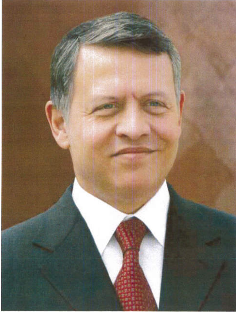
حضرة صاحب الجلالة الملك عبد الله الثاني ابن الحسين