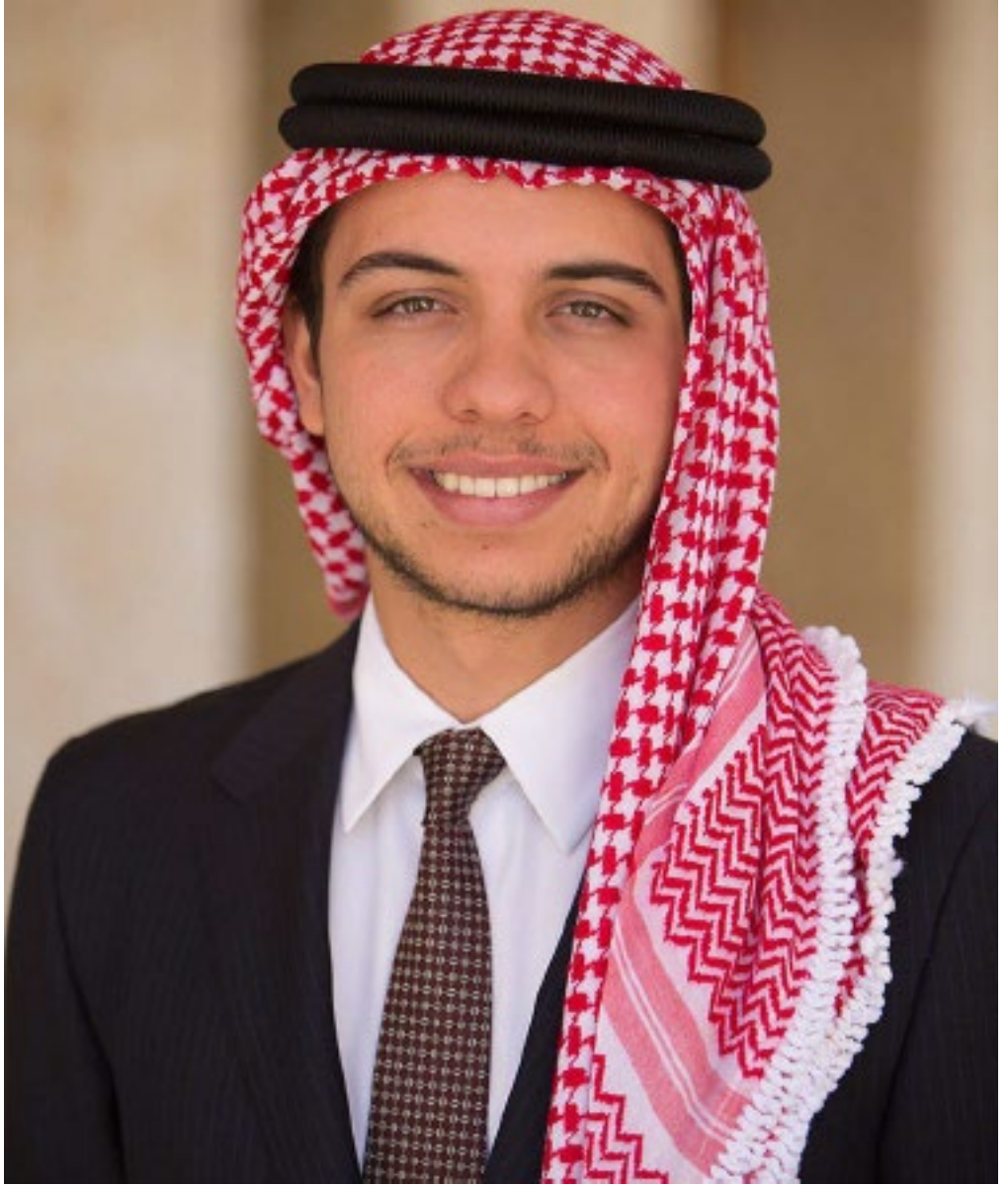
حضرة صاحب السمو الملكي الأمير حسين ولي العهد المعظم