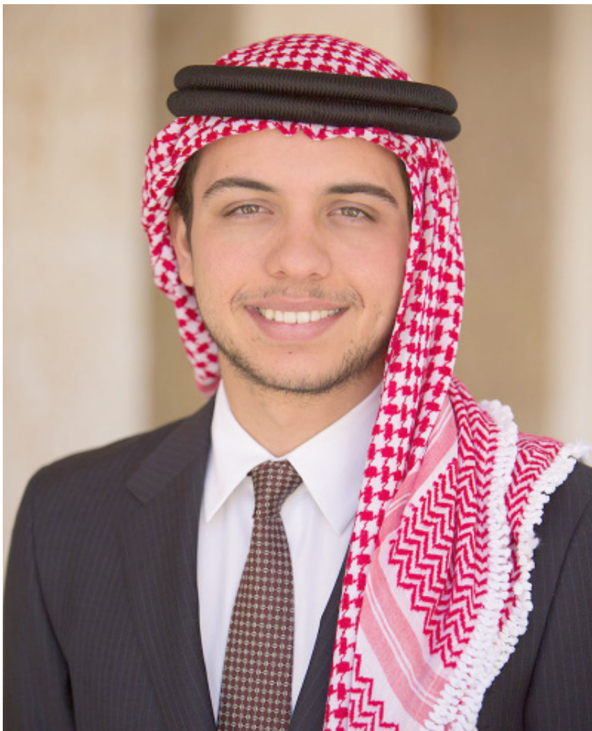
حضرة ولي العهد الحسين بن عبد الله الثاني حفظه الله ورعاه