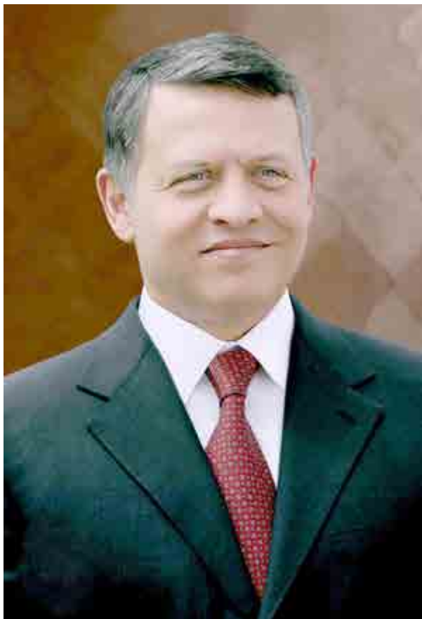
حضرة صاحب الجلالة الملك عبد الله الثاني بن الحسين حفظه الله ورعاه