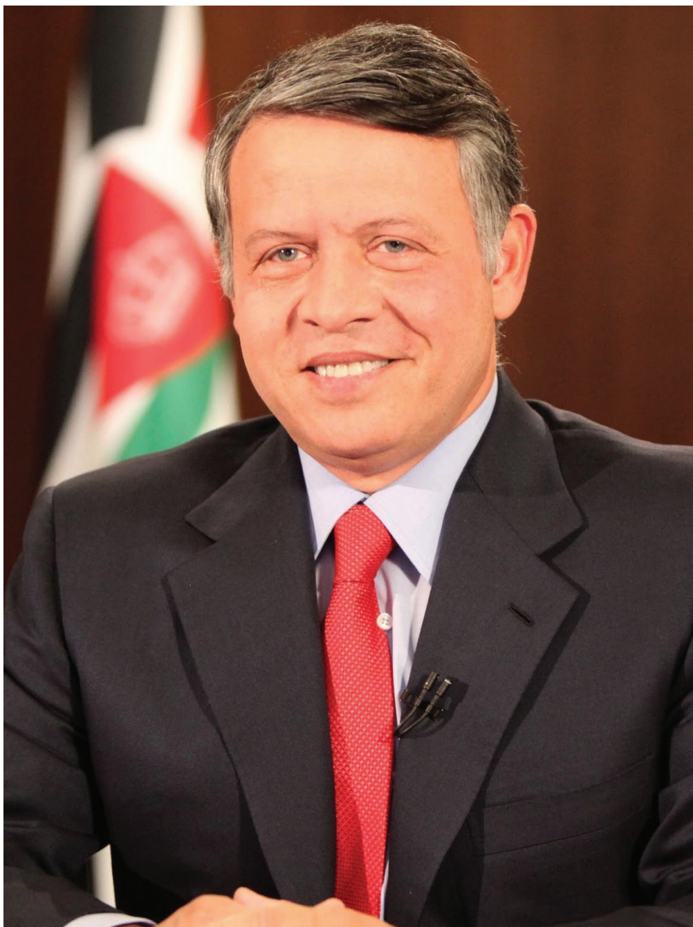
صاحب الجلالة الهاشمية الملك عبدالله الثاني ابن الحسين المعظم حفظه الله ورعاه