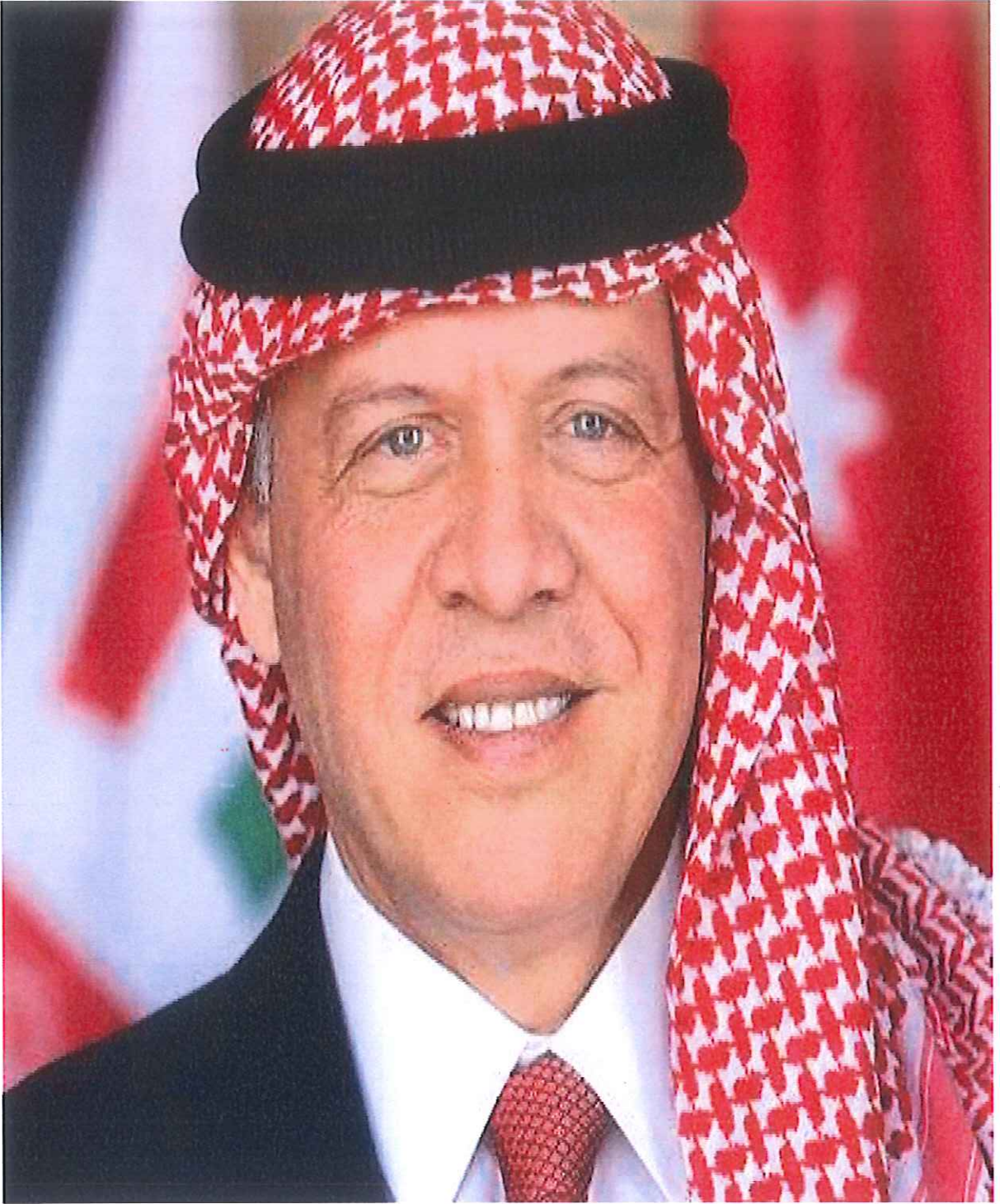
صاحب الجلالة الهاشمية الملك عبدالله الثاني بن الحسين المعظم