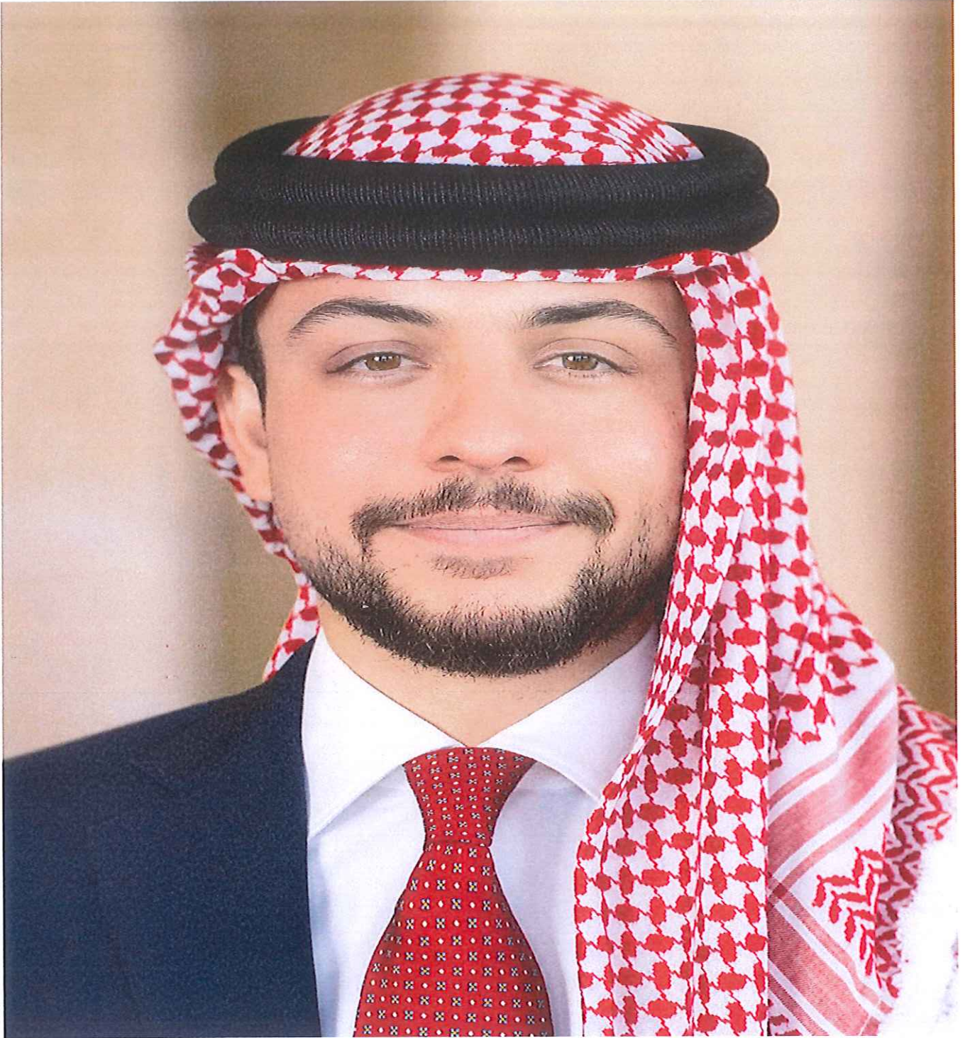
صاحب السمو الملكي ولي العهد الأمير الحسين بن عبدالله الثاني