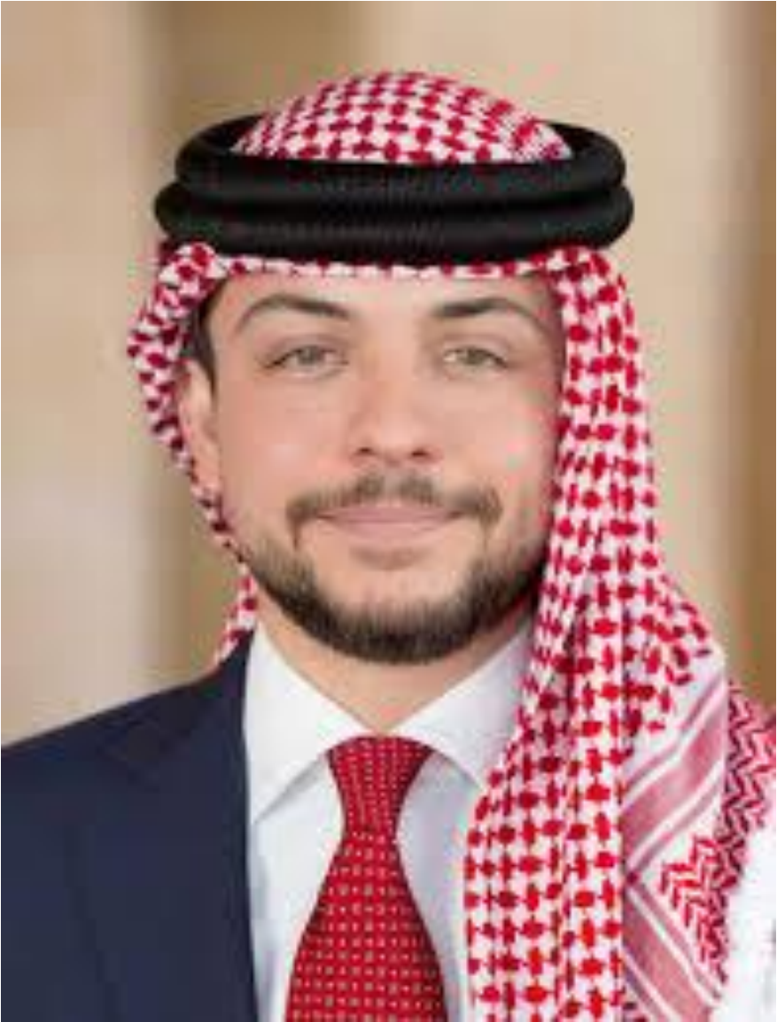
صورة سمو ولي العهد