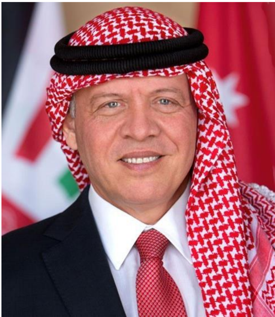
صورة جلالة الملك