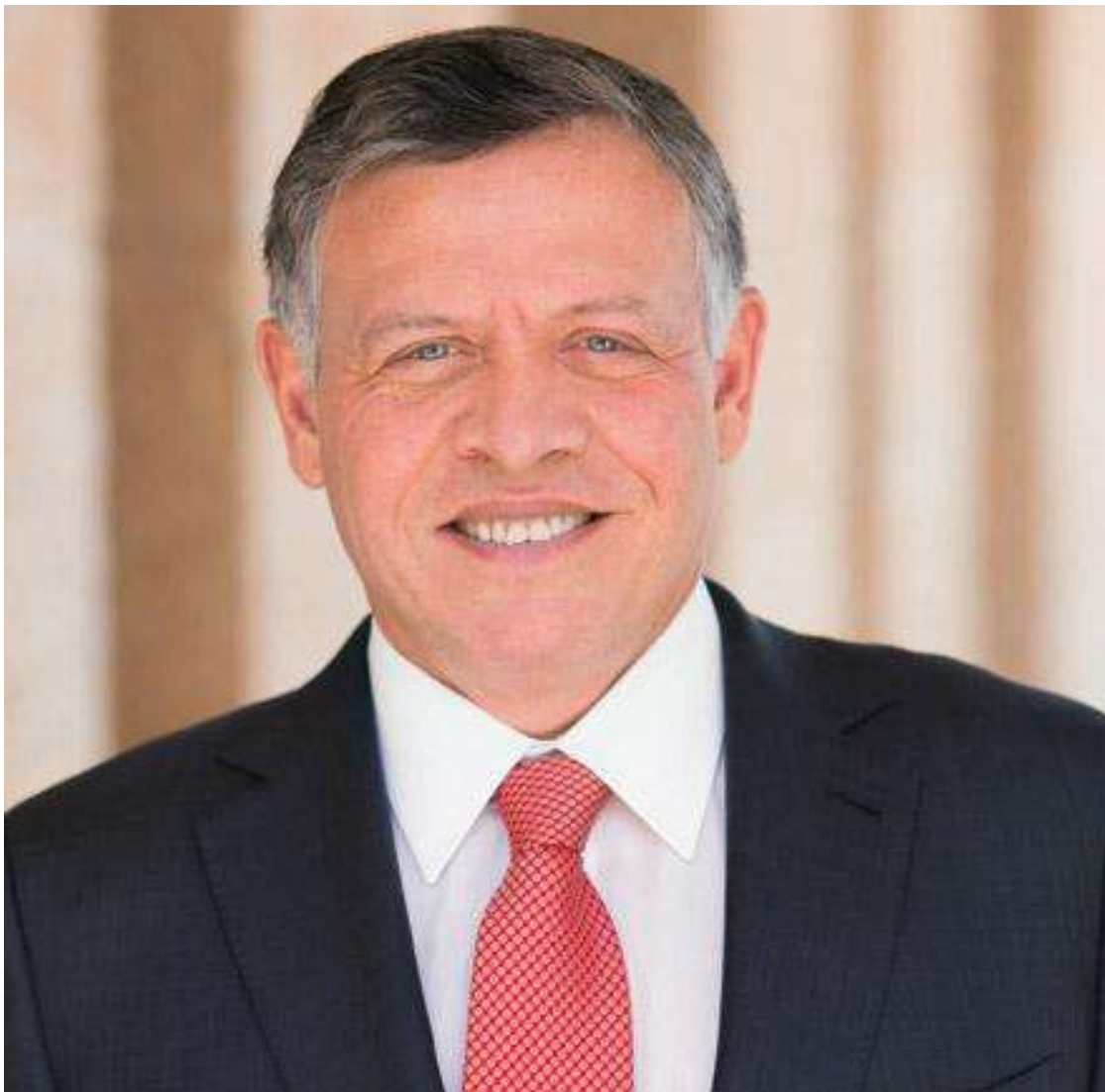
حضرة صاحب الجلالة ملك المملكة الأردنية الهاشمية عبدالله الثاني بن الحسين المعظم