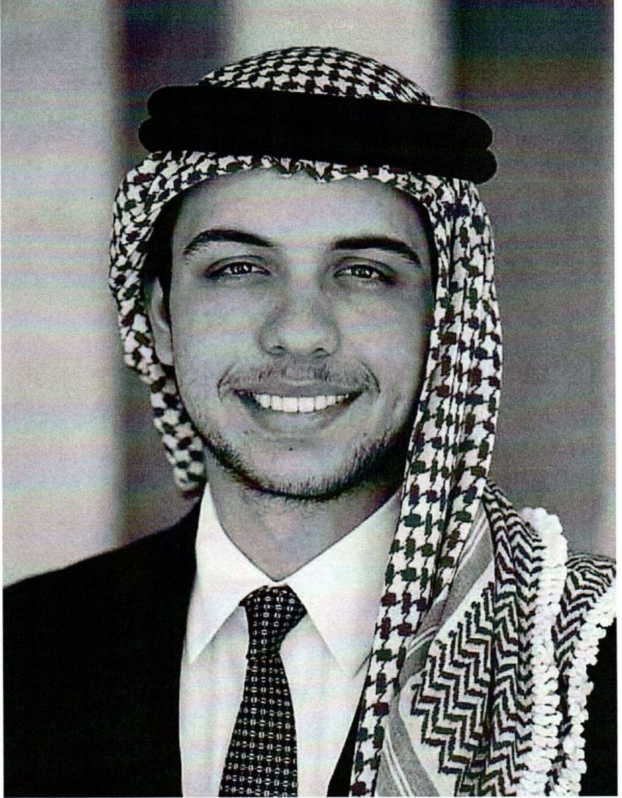
حضرة صاحب السمو الملكي الأمير الحسين بن عبدالله الثاني ولي العهد المعظم