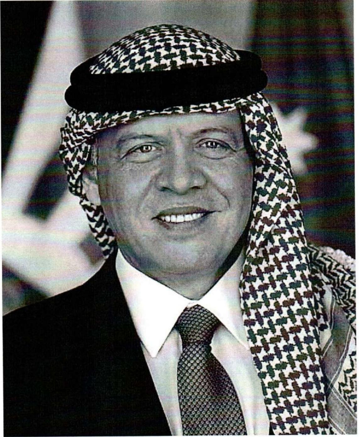
حضرة صاحب الجلالة الهاشمية الملك عبدالله الثاني بن الحسين المعظم