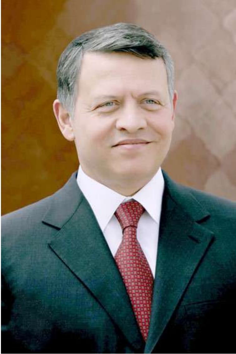
حضرة صاحب الجلالة الملك عبد الله الثاني بن الحسين المعظم