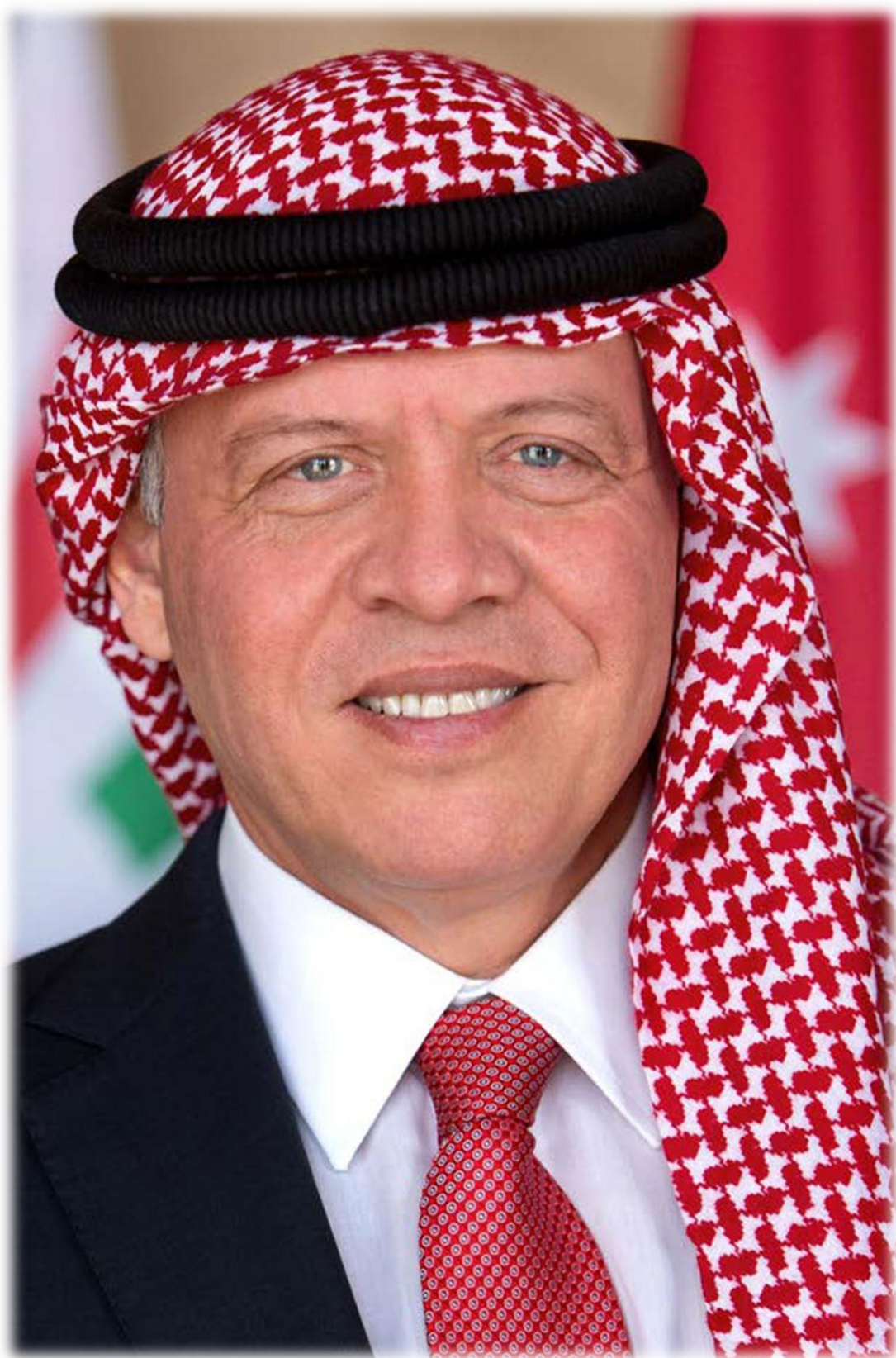
حضرة صاحب الجلالة الهاشمية الملك عبدالله الثاني بن الحسين المعظم