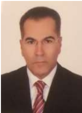
عضو مجلس إدارة