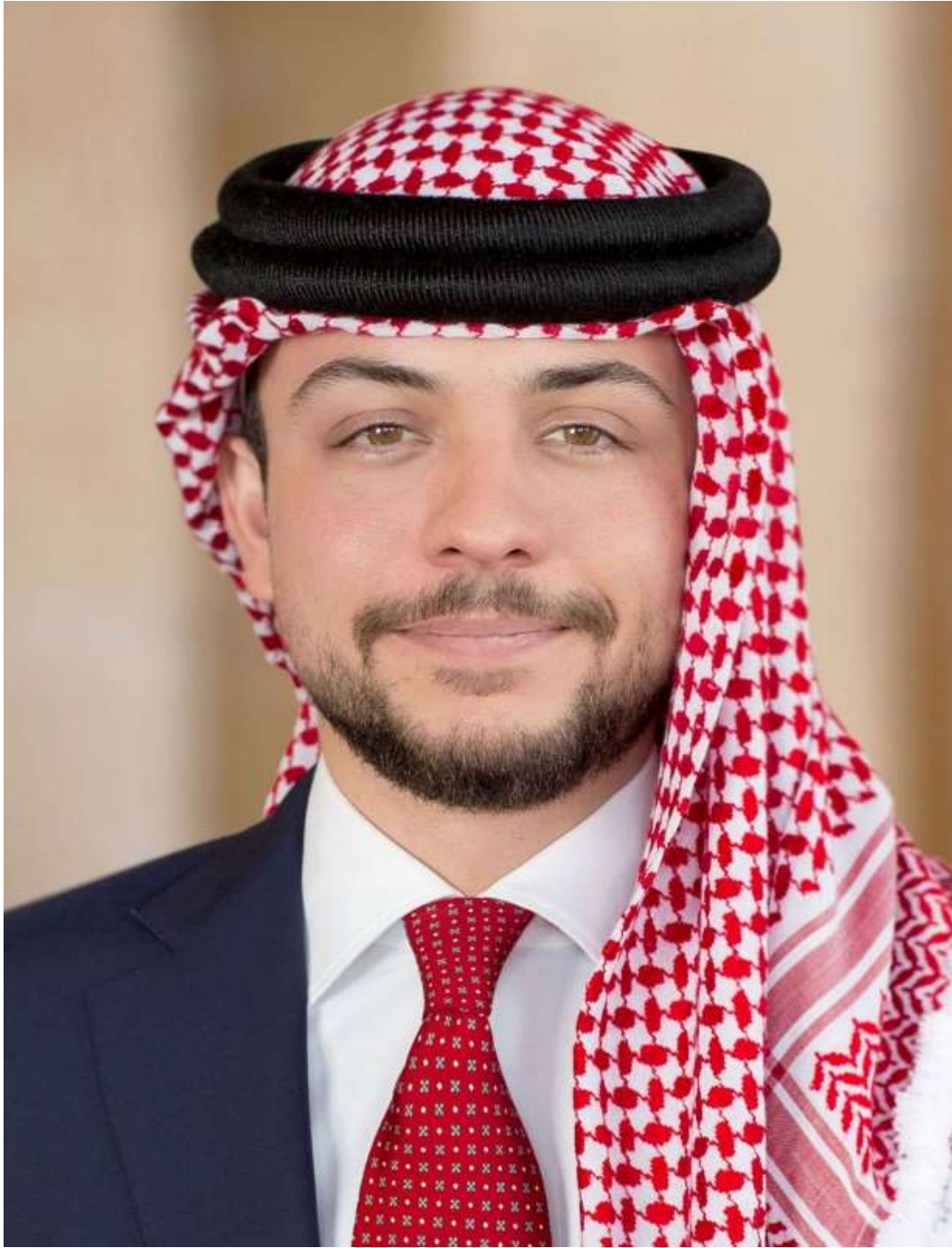
ولي العهد صاحب السمو الملكي الأمير الحسين بن عبدالله الثاني المعظم