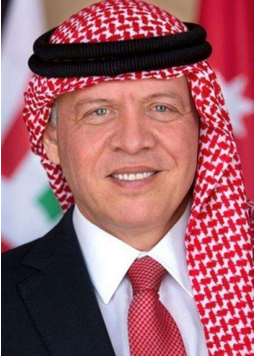
جلالة الملك عبدالله الثاني ابن الحسين المعظم