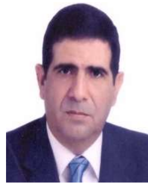
عضو مجلس إدارة