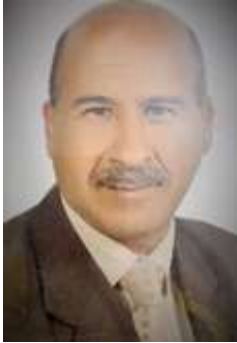
عضو مجلس إدارة