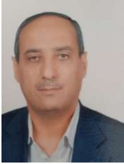
عضو مجلس إدارة