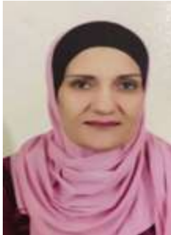
عضو مجلس إدارة