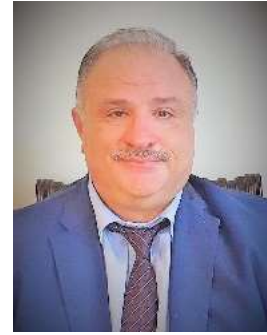
رئيس مجلس الإدارة