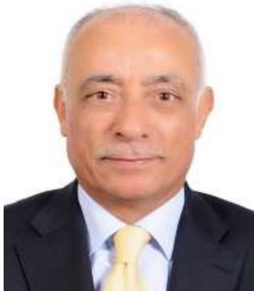
عضو مجلس إدارة