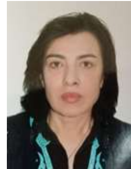
عضو مجلس إدارة