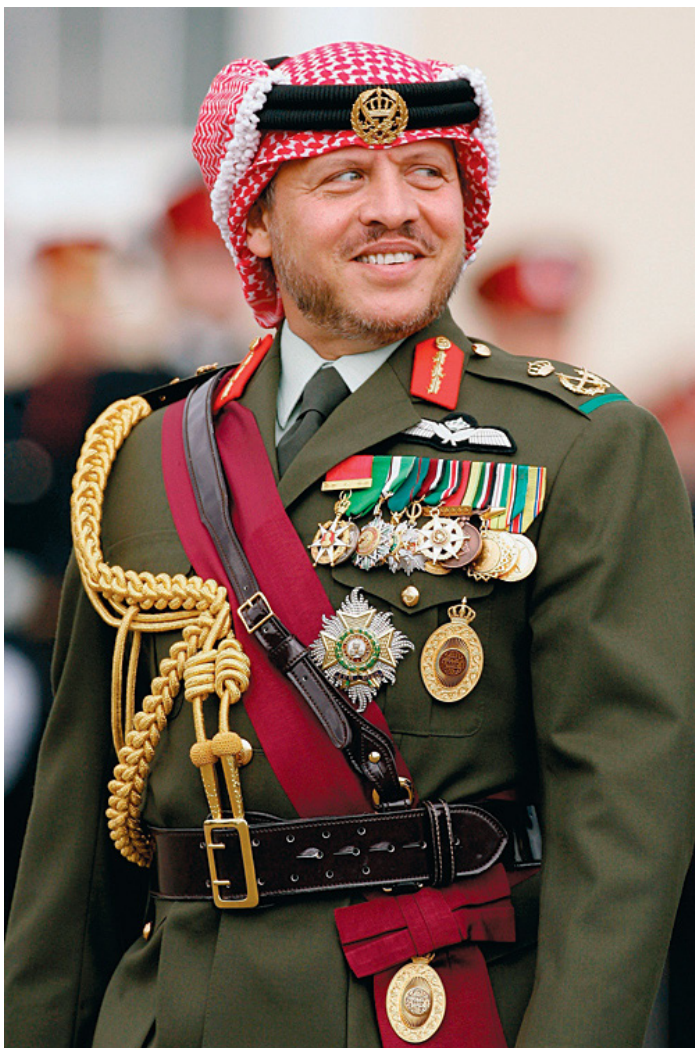
حضرة صاحب الجلالة الملك عبد الله الثاني بن الحسين المعظم