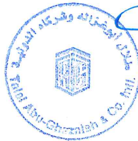
Mohammad Al-Azraq (License # 1000)