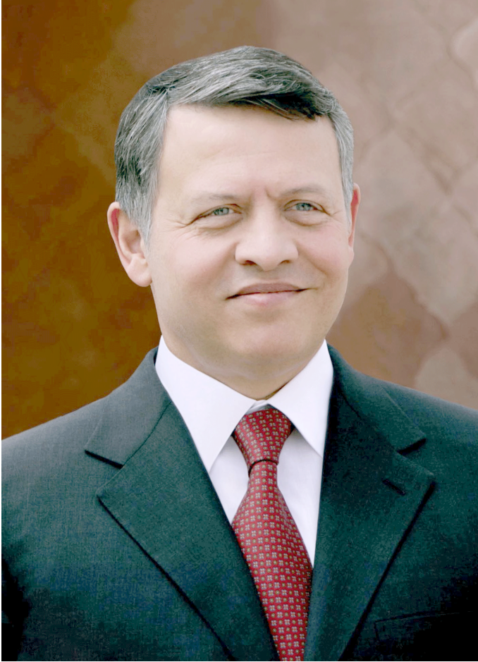
حضرة صاحب الجلالة الملك عبد الله الثاني بن الحسين حفظه الله ورعاه