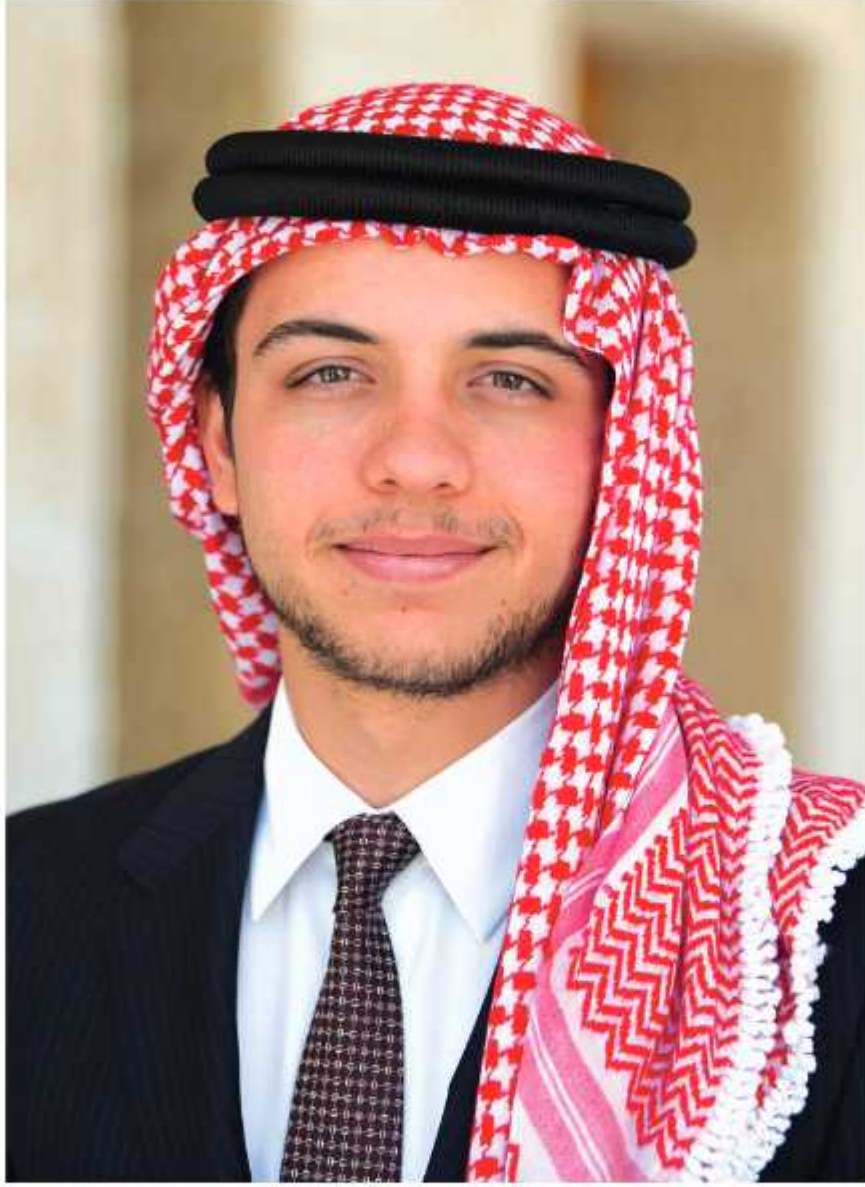
حضرة صاحب السمو الملكي الامير الحسين بن عبد الله الثاني ولي العهد المعظم