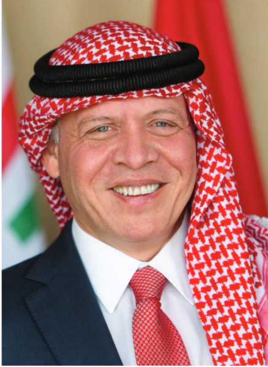
حضرة صاحب الجلالة الملك عبدالله الثاني ابن الحسين حفظه الله ورعاه