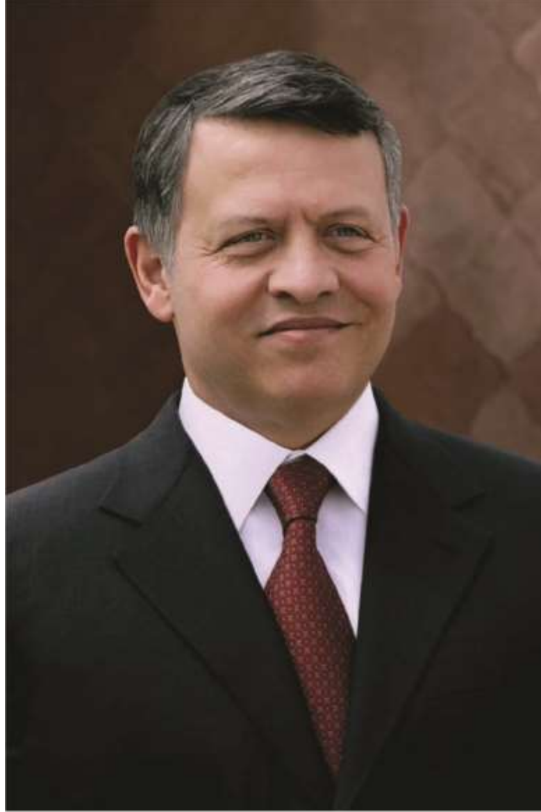
حضرة صاحب الجلالة الهاشمية الملك عبد الله الثاني ابن الحسين المعظم