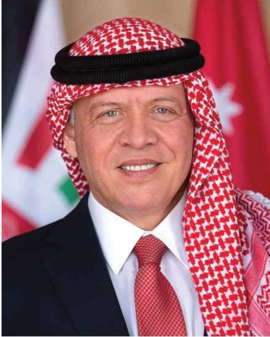
حضرة صاحب الجلالة الملك عبد الله الثاني بن الحسين المعظم